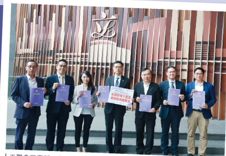
工聯會回應新一份《財政預算案》。