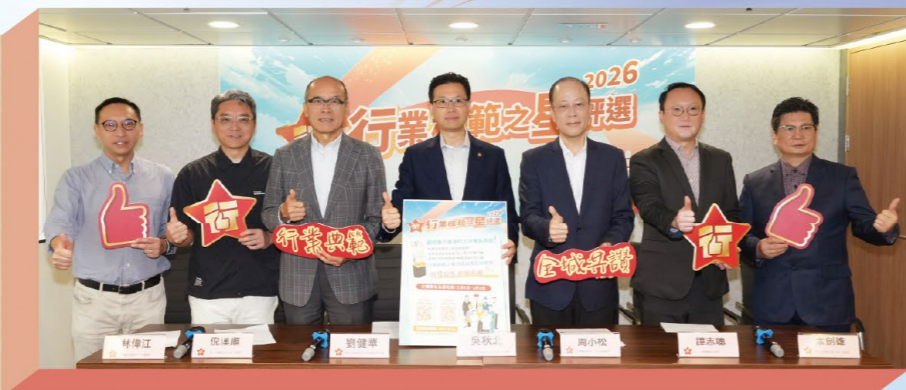
評審委員會代表於2月6日舉行記者會，簡介今屆評選詳情。

由香港工會聯合會牽頭，聯同勞工界、主要商會團體共同籌辦，並獲特區政府支持的「行業模範之星」2026年度評選於2月6日至3月9日公開接受報名及提名。評審委員會代表於2月6日舉行記者會，簡介今屆評選的宗旨及相關流程。評選以「行業典範 全城共讚」為口號，旨在表彰香港各行業各崗位的打工仔，肯定大家對香港的貢獻，藉此弘揚勞動精神，樹立專業典範，表彰先進，為社會注入更多正能量。