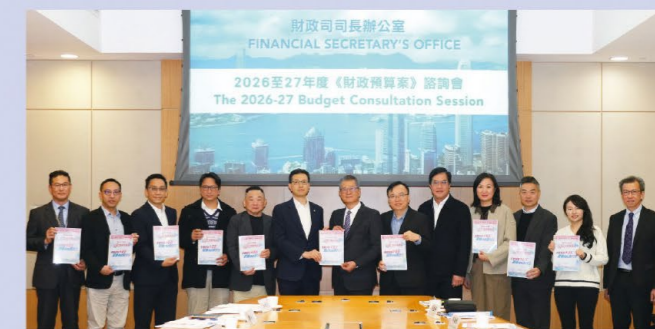
工聯會代表於2月2日向財政司司長遞交《2026-27年度財政預算案建議書》。

工聯會代表於2月2日上午與財政司司長陳茂波及多名政府官員會面，遞交了工聯會《2026-27年度財政預算案建議書》，同時向財政司反映了早前工聯會收集並整理的5,000多名市民對《財政預算案》的期望問卷調查結果。