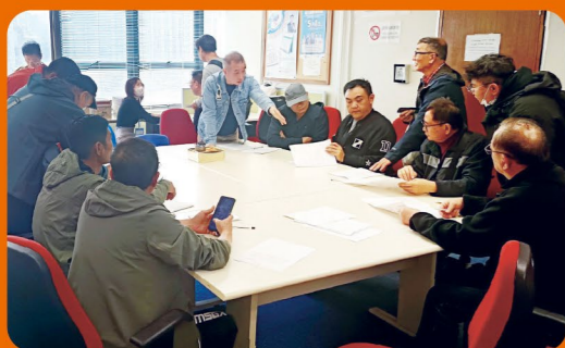
國泰航空服務工會：協助外判員工到勞工處追討有薪年假及勞工假