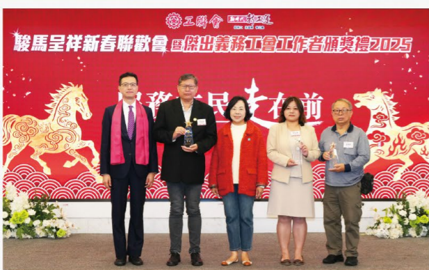
發展及鞏固會員表現傑出團體金銀銅獎