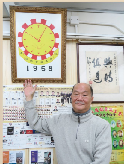
為紀念國慶節，鐘錶工會在設計會徽時，將指針指向10月1日。

握表面知識，進入職場後仍需重新培訓，導致大型錶行對這些畢業生的聘用意願大幅下降。此外，年輕人即使入行，在師傅工作繁忙的情況下，往往無法獲得足夠的指導，使他們對未來感到失望，甚至選擇轉行。