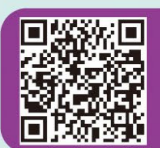
查閱勞工法例知多少電子版本以獲得最新資訊