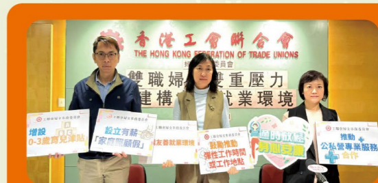
工聯婦委：發布「香港婦女精神健康」調查結果，雙職婦女雙重壓力，倡建構友善就業環境