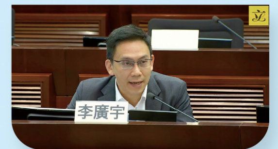
李廣宇在立法會發言

踏入議會後，李廣宇希望將多年跨界實戰經驗帶入勞工界工作，緊貼社會發展趨勢，積極就產業轉型與勞工保障，向政府及各界持份者提出具體可行建議。着力加強前線和在職工友技能培訓，在社會轉型關鍵階段，為工友提供技能晉階與轉型機會，穩住就業根基。