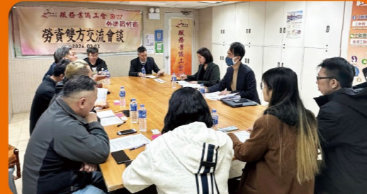
外送員分會：與Foodpanda平台公司舉行勞資雙方交流會談