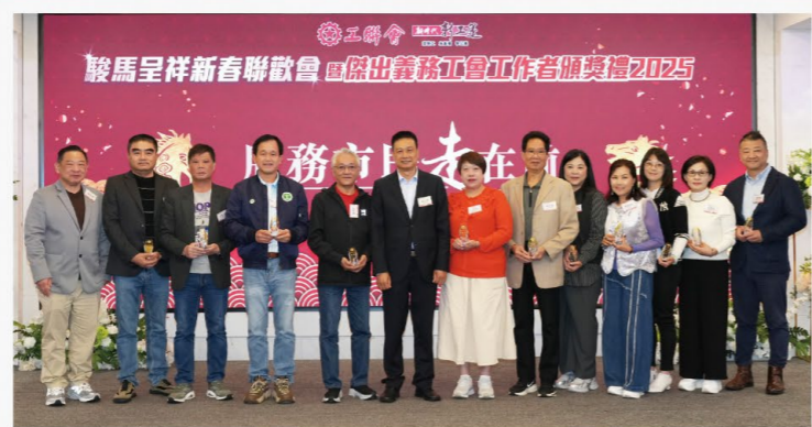
傑出義務工會工作者金獎

緊貼人工智能的新時代大趨勢，今年大會安排AI智能機械人為得獎義工們以及在場所有參加者，帶來精彩的醒獅表演，現場氣氛熱烈。