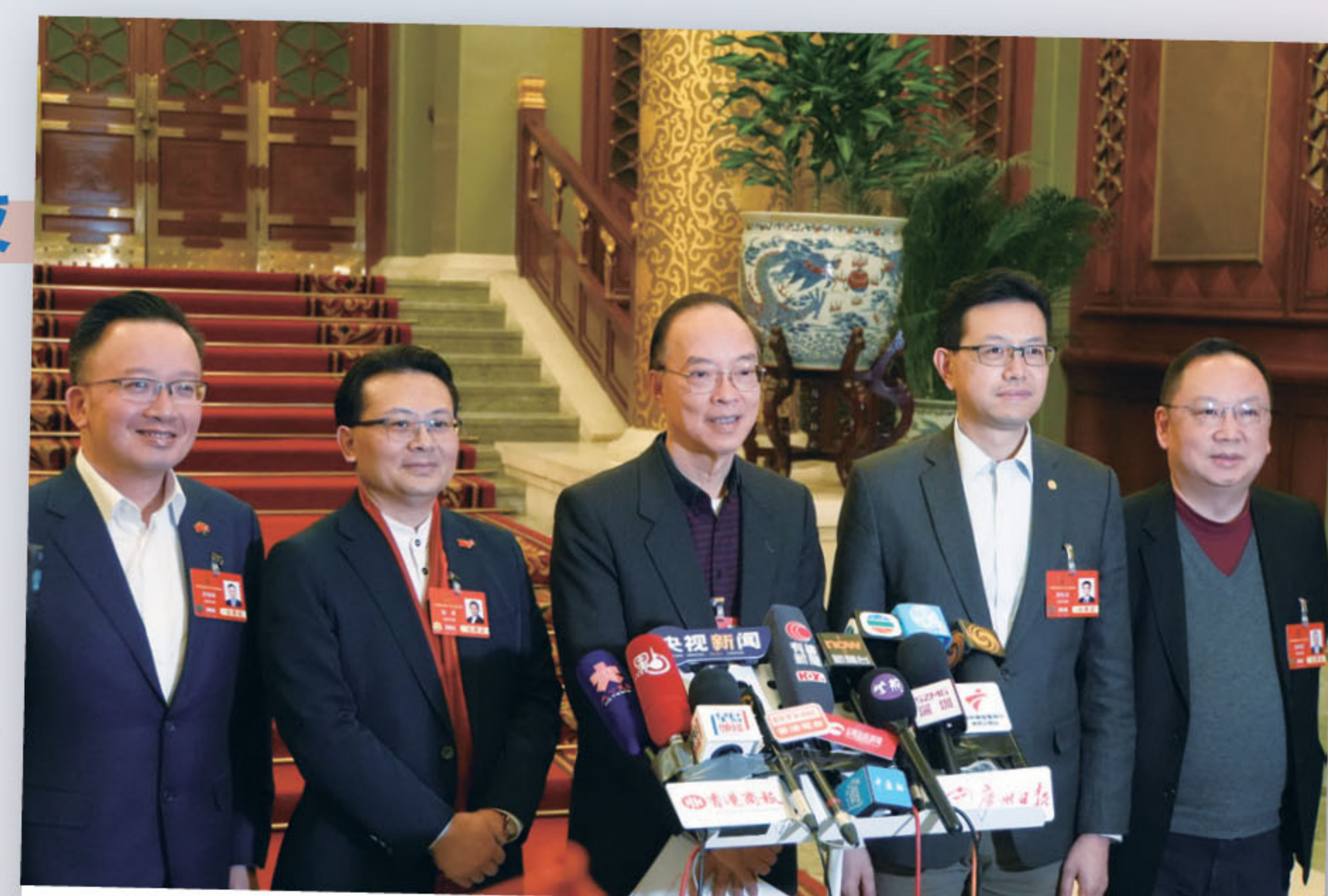
■ 全國兩會期間，就港人關心的議題，港區全國人大代表團與傳媒朋友會面。