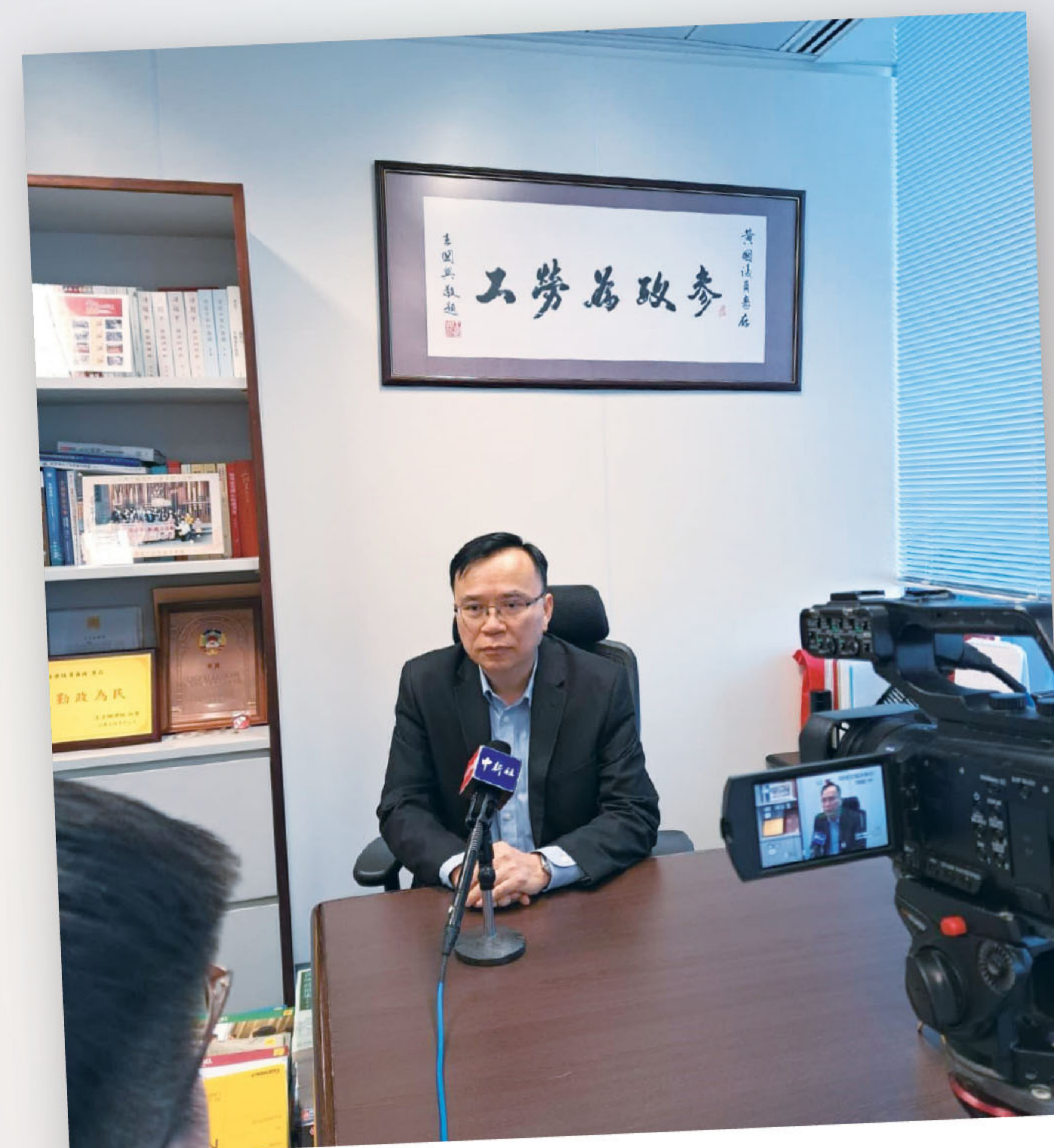
■ 就全國兩會期間關注的議題接受傳媒訪問。

在全國兩會期間，通過提交提案及反映社情民意資訊，進一步推動粵港澳大灣區醫療、養老深化合作；建立港人在內地遇事求助機制，設立專責機構處理港人在內地的民生求助、諮詢和投訴；推動「南沙方案」深度落實；強化大灣區在職業教育培訓和實習的合作，助力香港更好融入國家發展大局，因地制宜發展新質生產力。