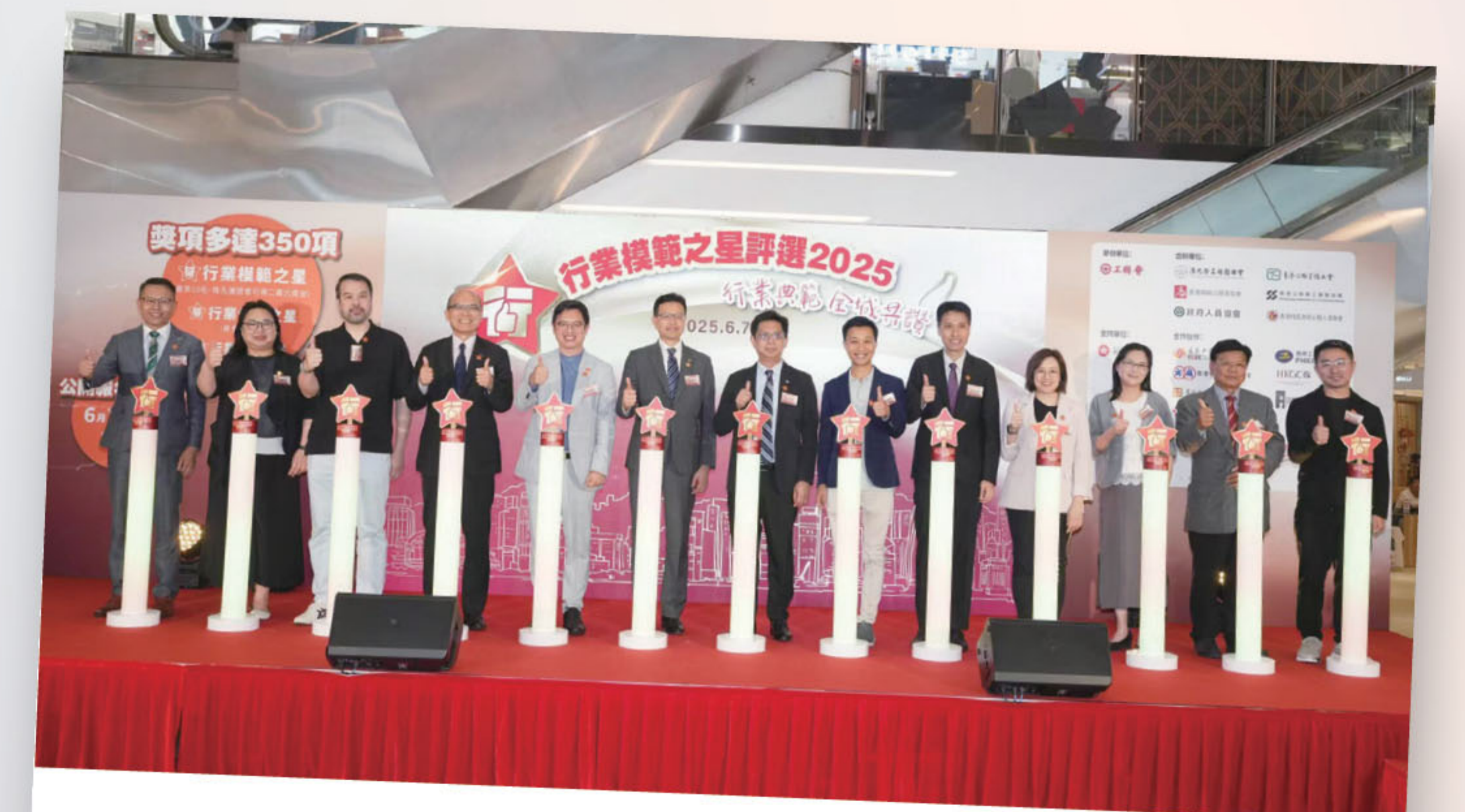
■ 在香港牽頭勞工界舉辦行業模範之星評選，以弘揚勞模精神、勞動精神、工匠精神。

過去一年，本人與工聯會提出的多項建議取得一定成效，但仍需持續努力。今後我將繼續履行人大代表職責，緊扣國家與香港發展需求，為香港融入國家大局、維護勞工權益、改善民生福祉、守護國安穩定持續發力，為香港繁榮穩定與民族復興貢獻力量。