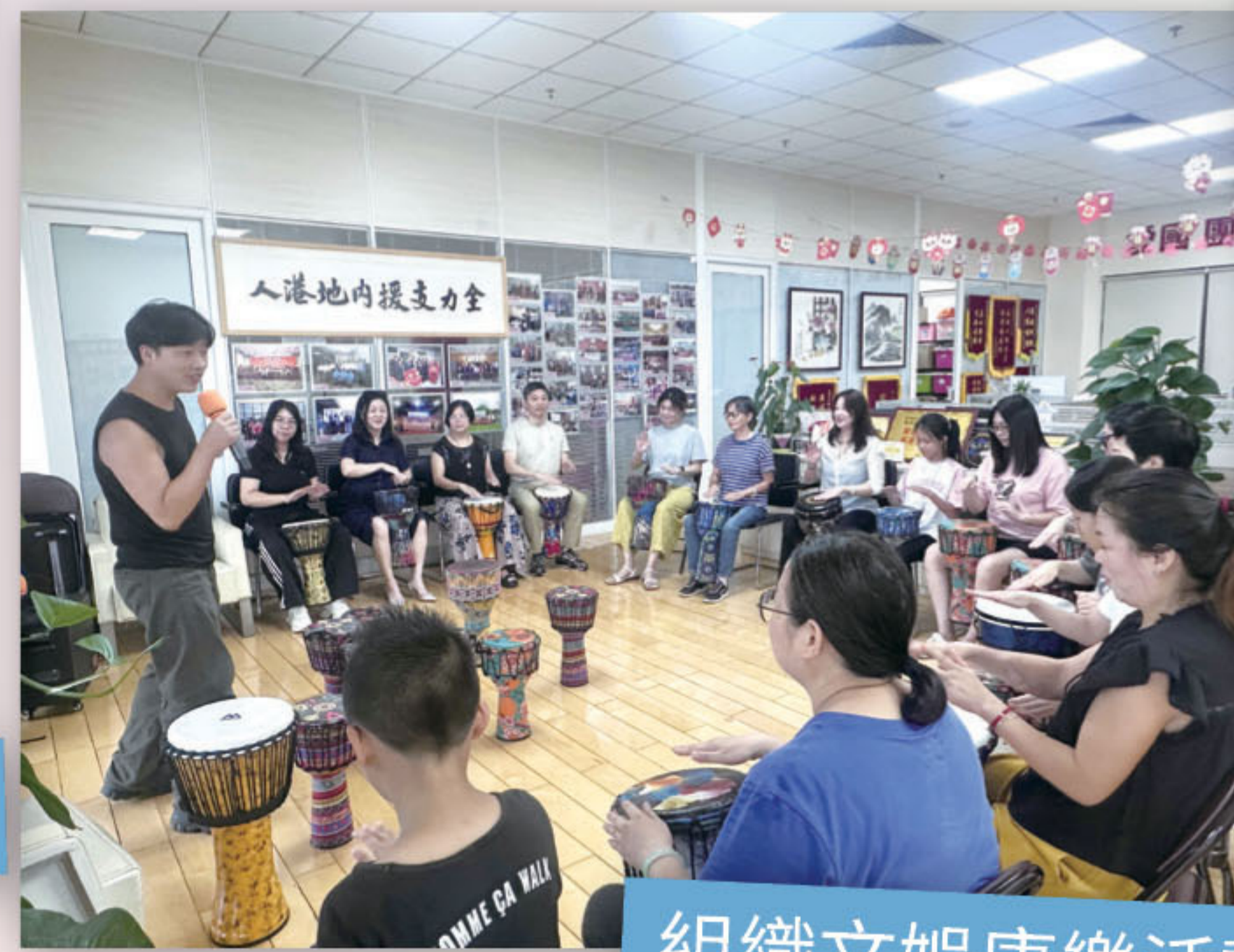
組織文娛康樂活動