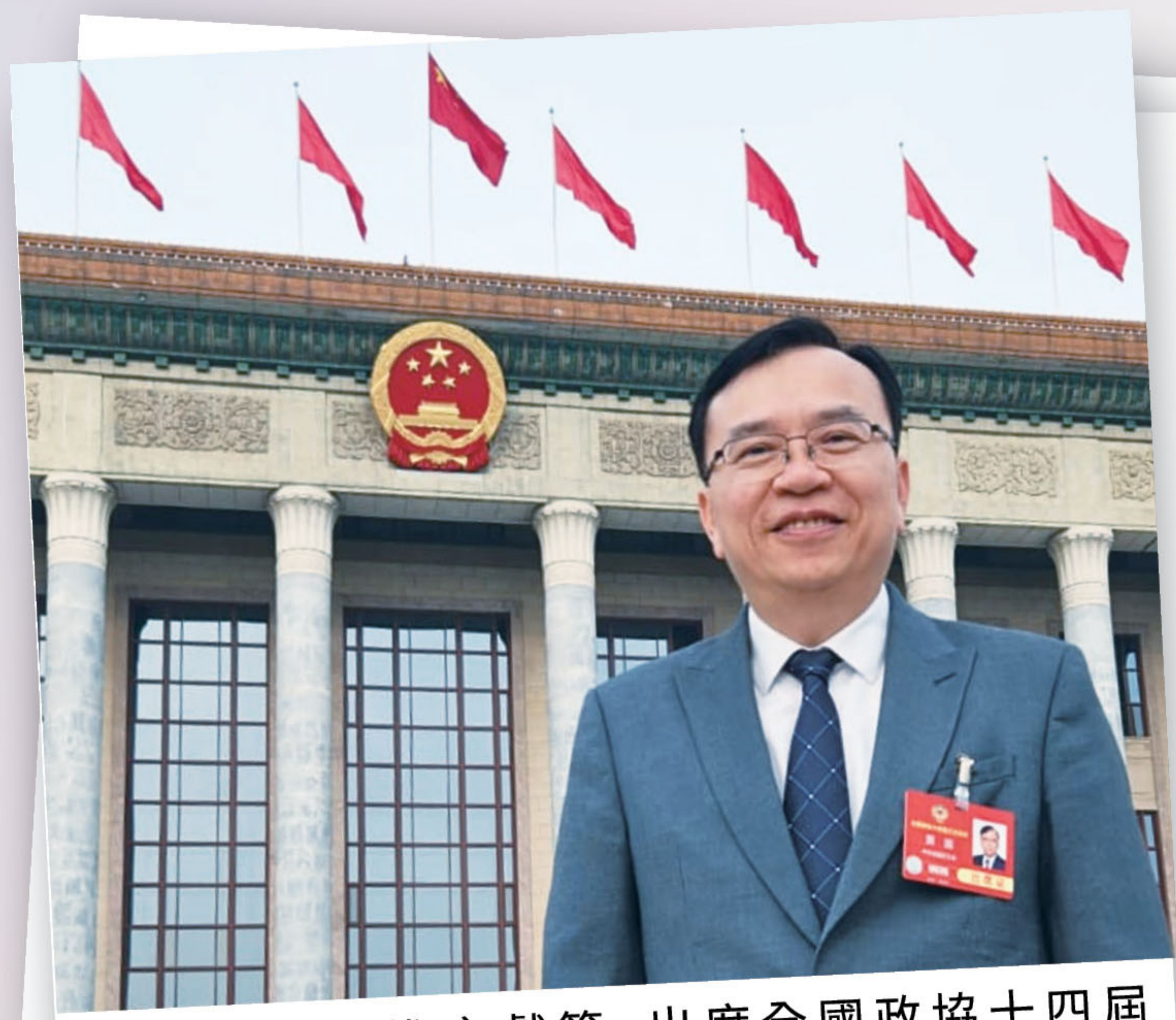
■ 積極履職，進言獻策，出席全國政協十四屆三次會議。