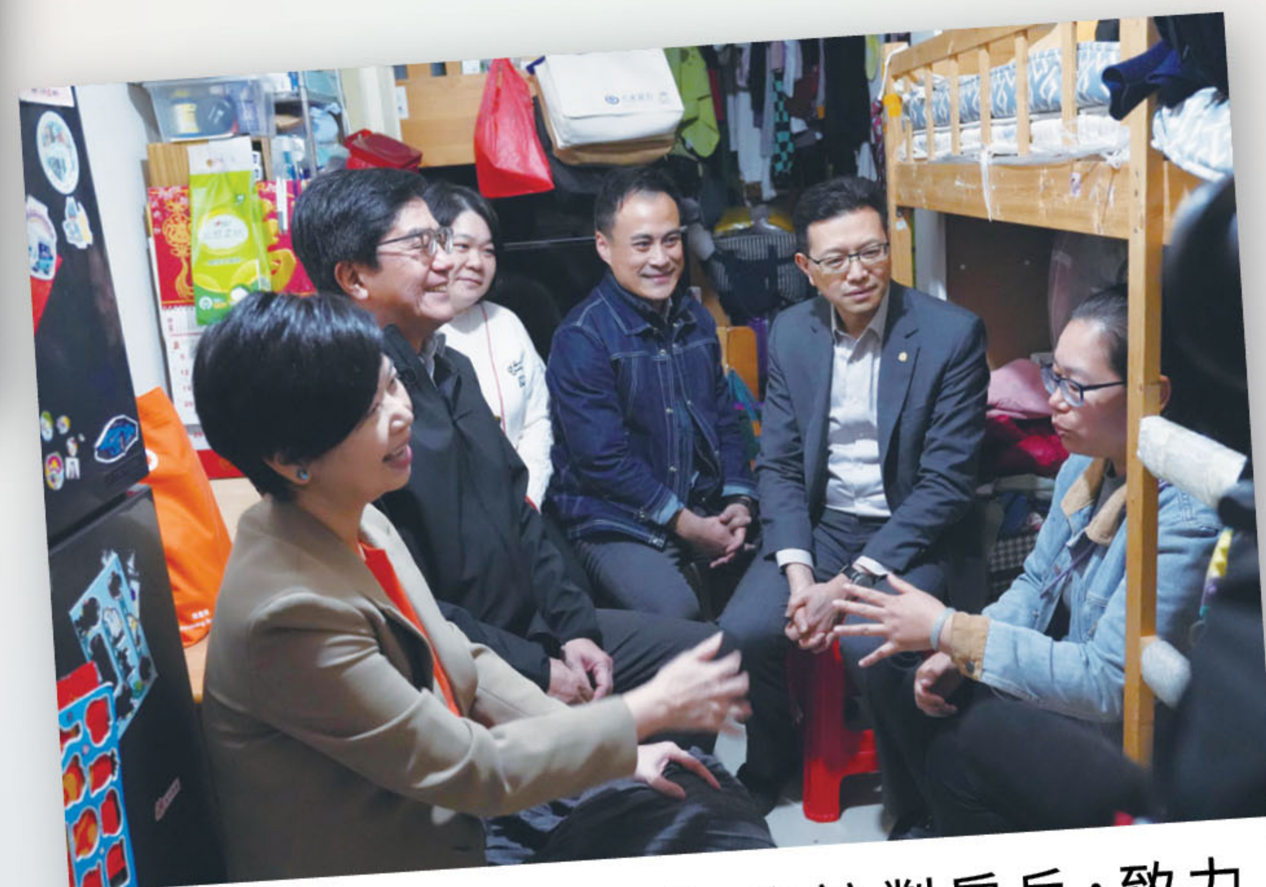
■ 連同特區政府官員，走訪劏房戶，致力破解香港市民「住屋難」問題。