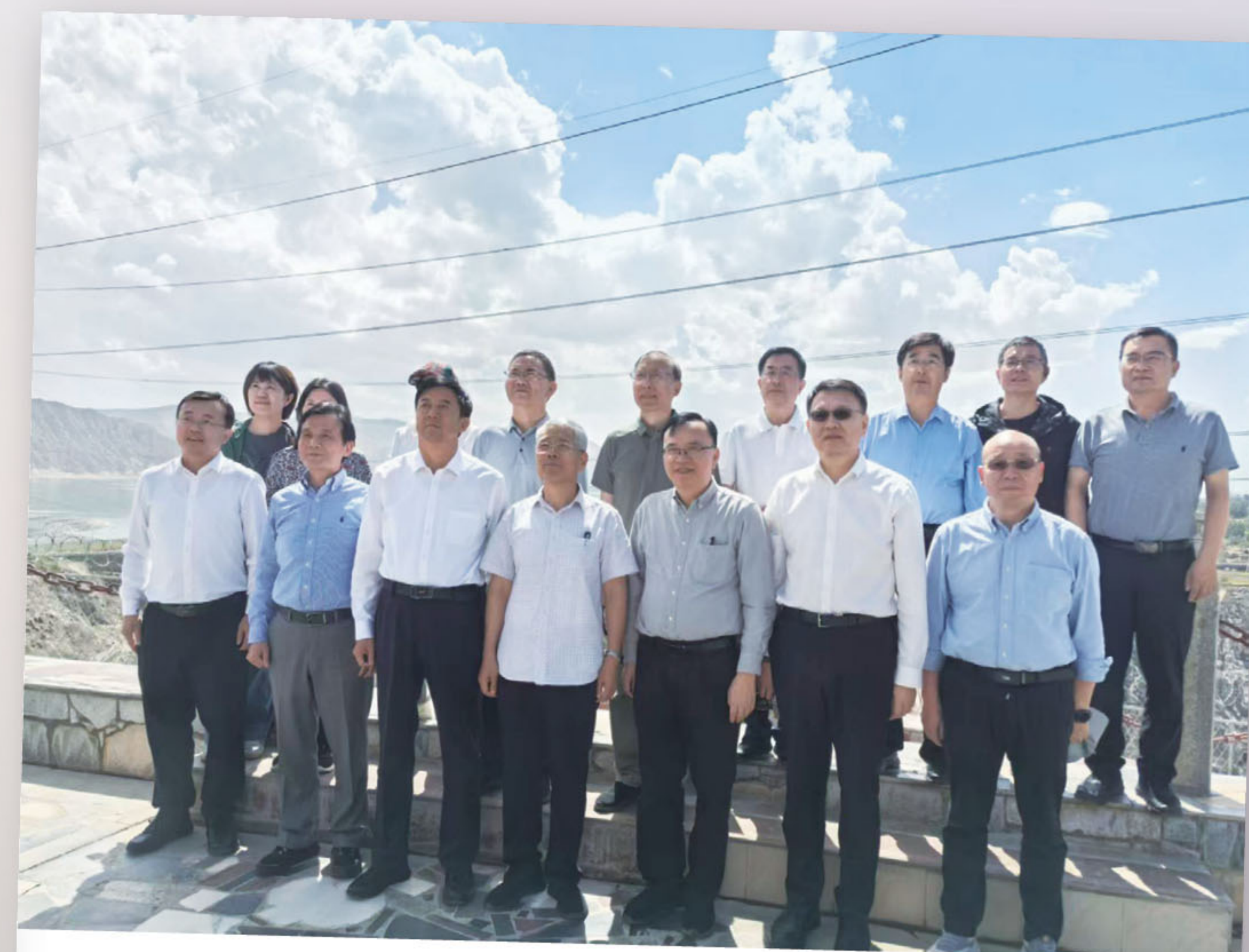
■ 全國政協提案委員會前赴青海視察調研，體現青海在發展綠色能源，保護環境生態，做了大量工作，成績顯著。

展望未來，我將繼續恪盡職守，發揮好橋樑與紐帶的作用，堅定貫徹「一國兩制」方針，共同維護國家主權、安全、發展利益，推動香港主動融入和服務國家發展大局，切實排解民生憂難，提升市民獲得感、幸福感、安全感，以行動貫徹「愛國者治港」，以實際成果展現「由治及興」。