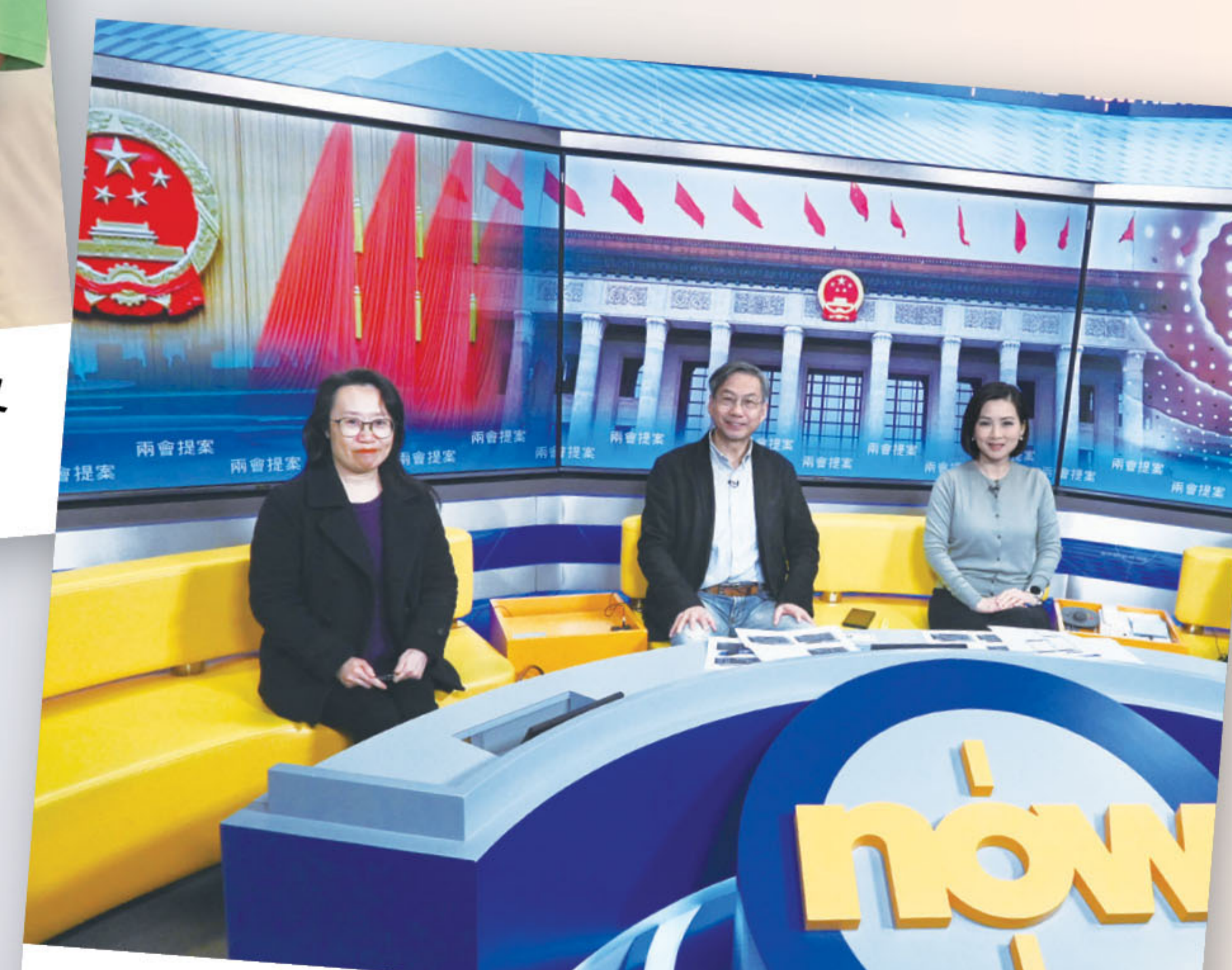
■ 接受傳媒訪問，介紹兩會關注議題。