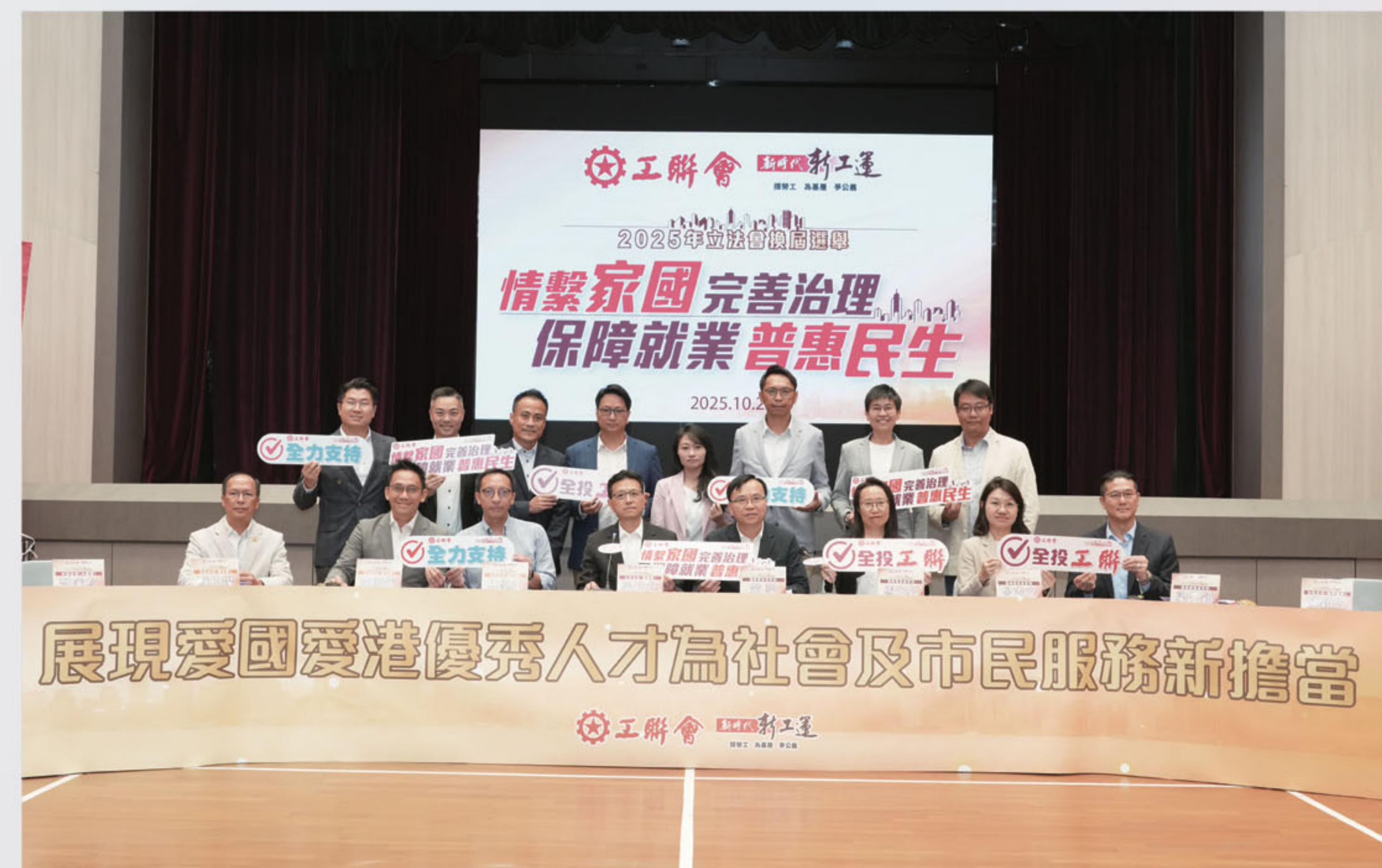
工聯會感謝在這場選舉過程中，社會各界人士、同鄉社團以及義工朋友及廣大市民對工聯會參選團隊的鼎力支持。