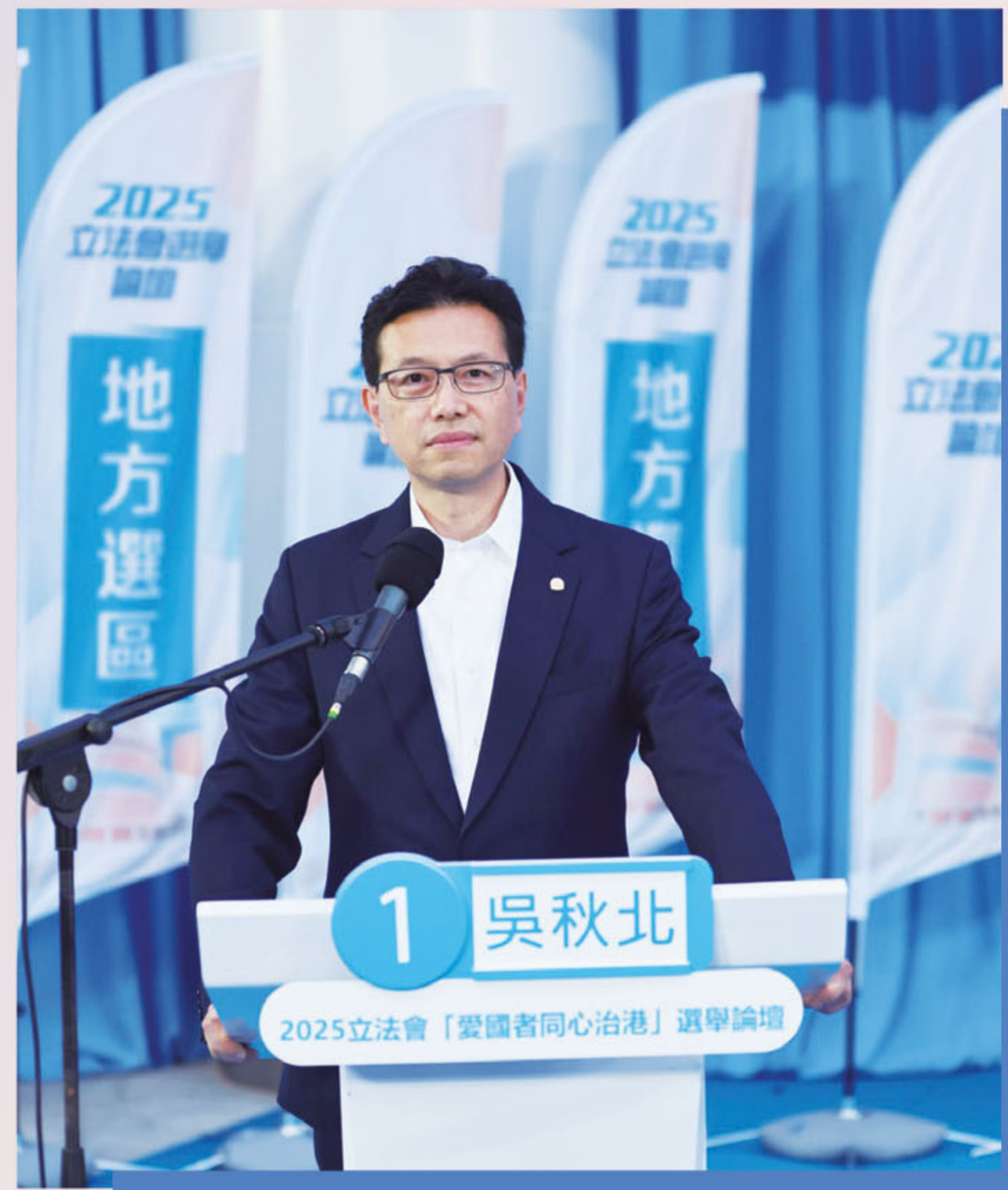
出席「愛國者同心治港」選舉論壇，就選民關心議題與各候選人進行良性互動。