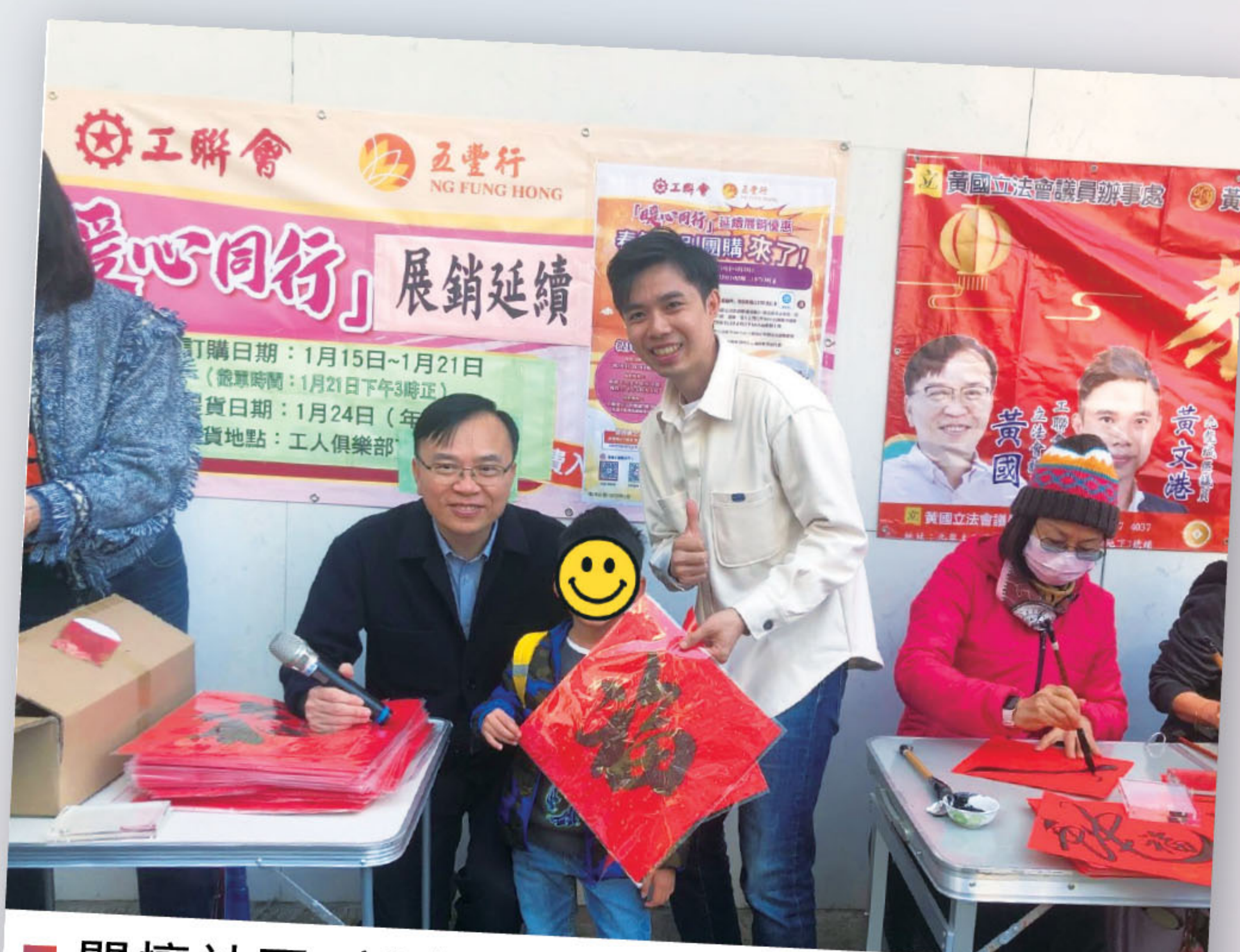
■ 關懷社區，新春開設街站與聆聽市民意見。

我持續關注大灣區民生合作議題，推動經濟轉型升級高質量發展，又積極發掘融入大灣區發展紅利，破解本港社會民生難題，就業、房屋、醫療、退休等是香港市民最關心的社會民生議題。隨著粵港澳大灣區加速融合發展，越來越多香港居民選擇到內地工作、生活和養老，跨境醫療成為他們最關心的議題之一。致力推動擴大長者醫療券在大灣區的使用範圍，經過多番努力，醫療券的使用範圍已擴展至大灣區九市，並涵蓋牙科服務，為香港人提供了多個選擇，廣受歡迎。