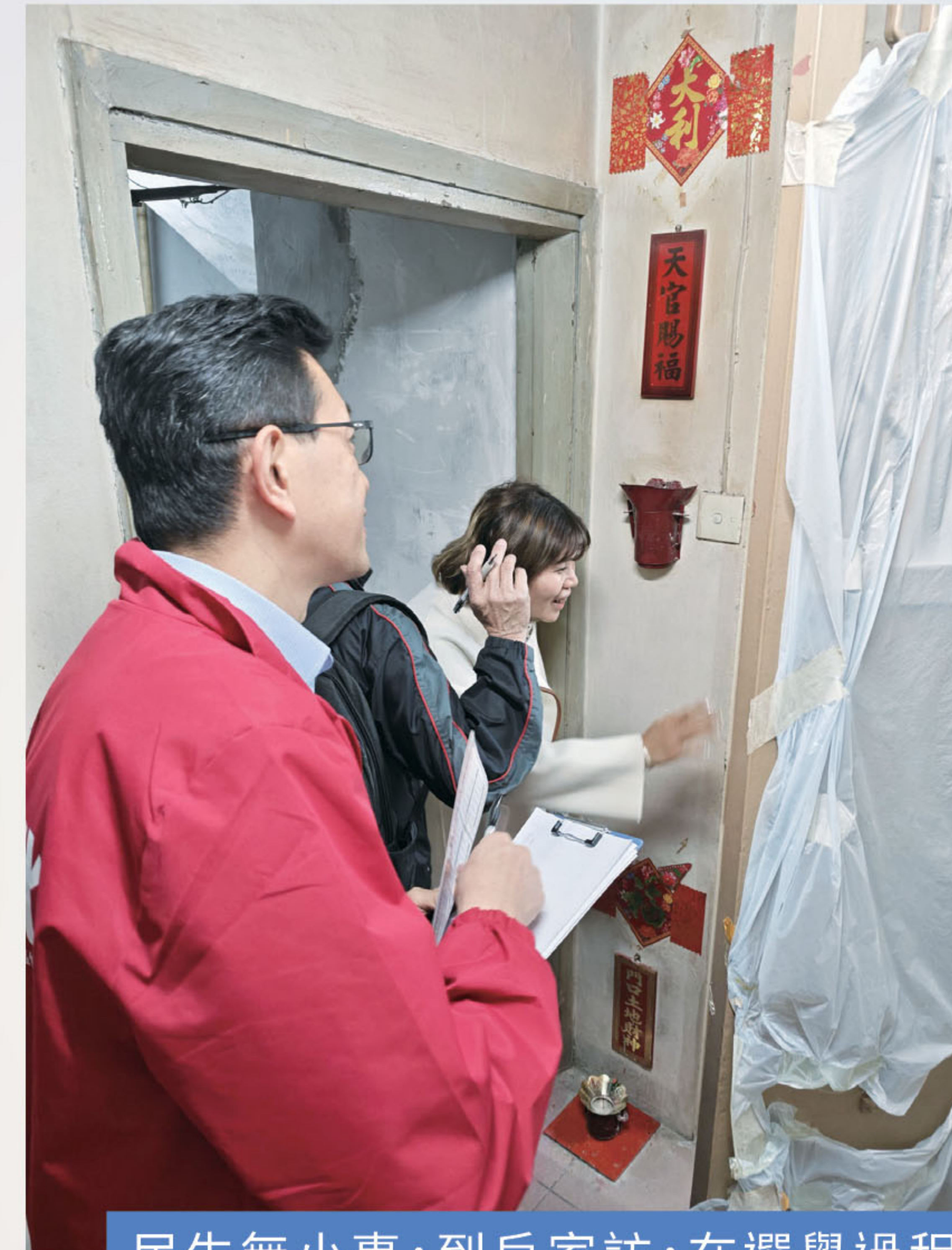
民生無小事，到戶家訪，在選舉過程中深入調研香港社區現況，致力解決香港市民遇到的各類民生問題。