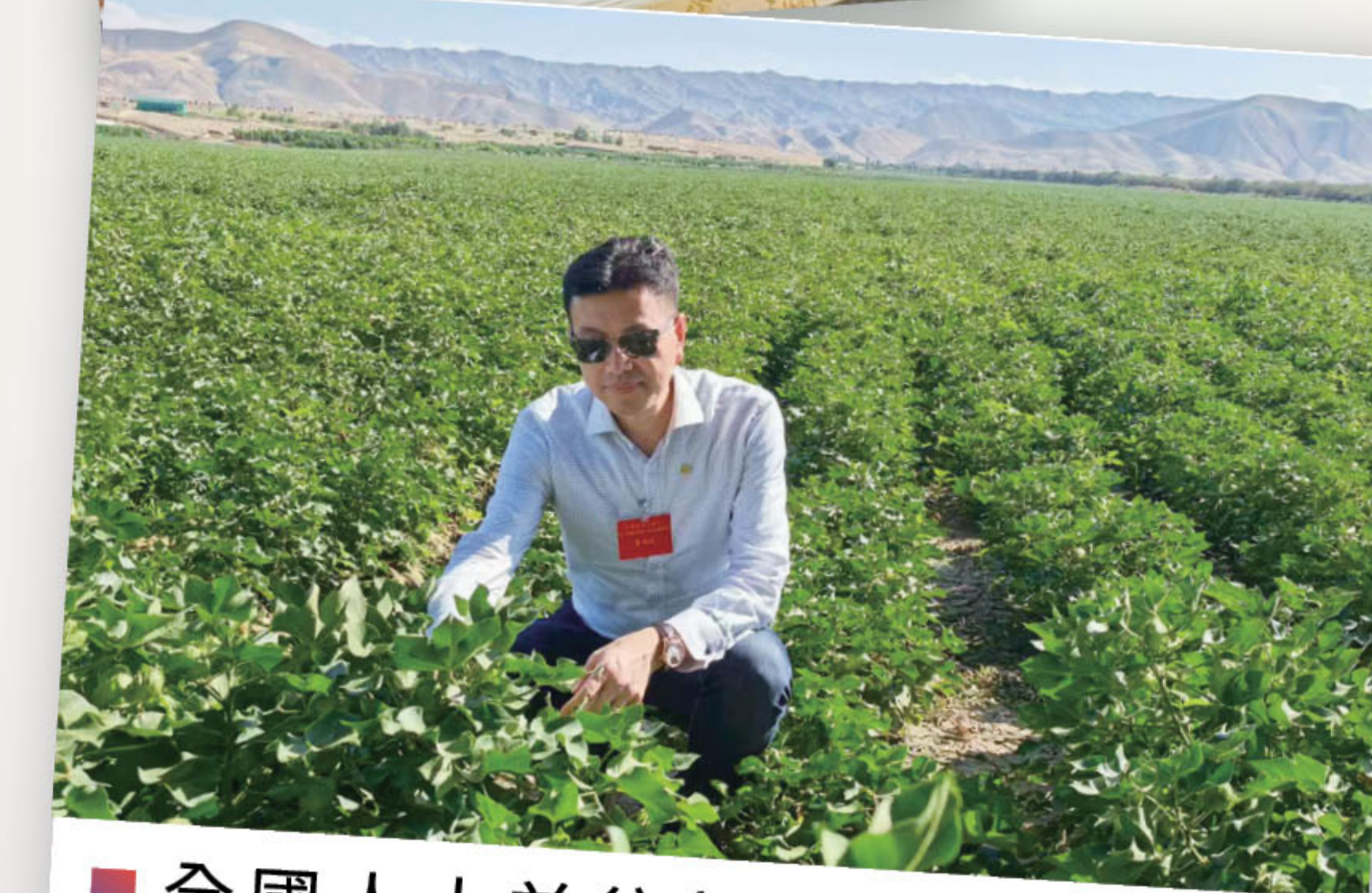
■ 全國人大前往新疆考察，就新疆當地社會發展、農業現況進行實地走訪。並與當地村幹部、村民親切交流。

立足工聯會根基，針對香港建造業輸入勞工遭剝削問題，提出加強內地輸港勞務中介監管，建立工會主導的監督窗口與兩地勞資糾紛協調機制，保障外勞合法權益。全國兩會期間，我明確倡議以「888工作制」取代「996」，呼籲落實法定8小時工作制，平衡勞工工作與生活，守護勞工身心健康與尊嚴，引發社會廣泛共鳴，推動合理工時制度討論與完善。