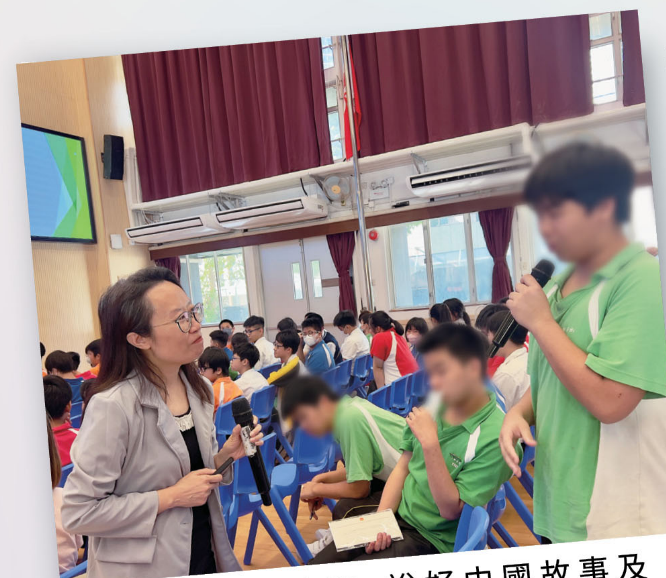
■ 進社區、進校園，說好中國故事及「一國兩制」故事。

未來，會堅持不忘初心、守正創新，以謙卑的態度不斷學習及接受新的挑戰，在國家高質量發展的進程中，發揮人民政協的「雙重積極作用」，進校園、入社區、說好強國建設的中國故事，把握灣區發展機遇，使香港更好融入及服務國家發展大局。