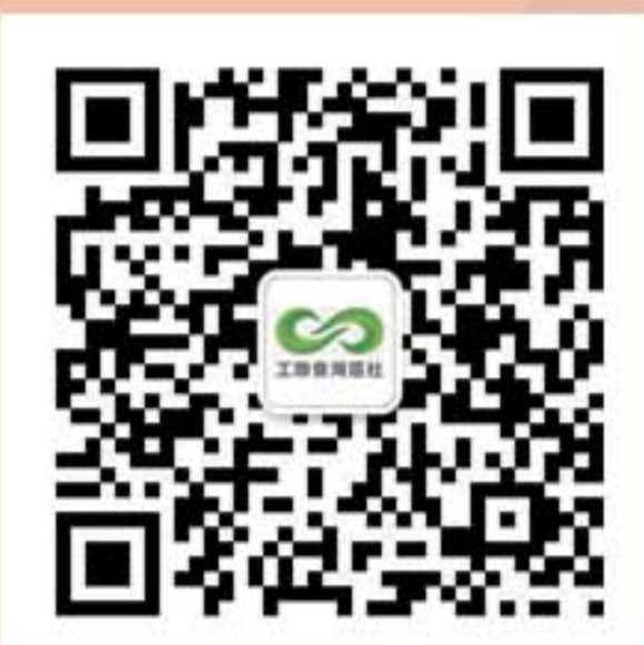
灣區社 微信公眾號