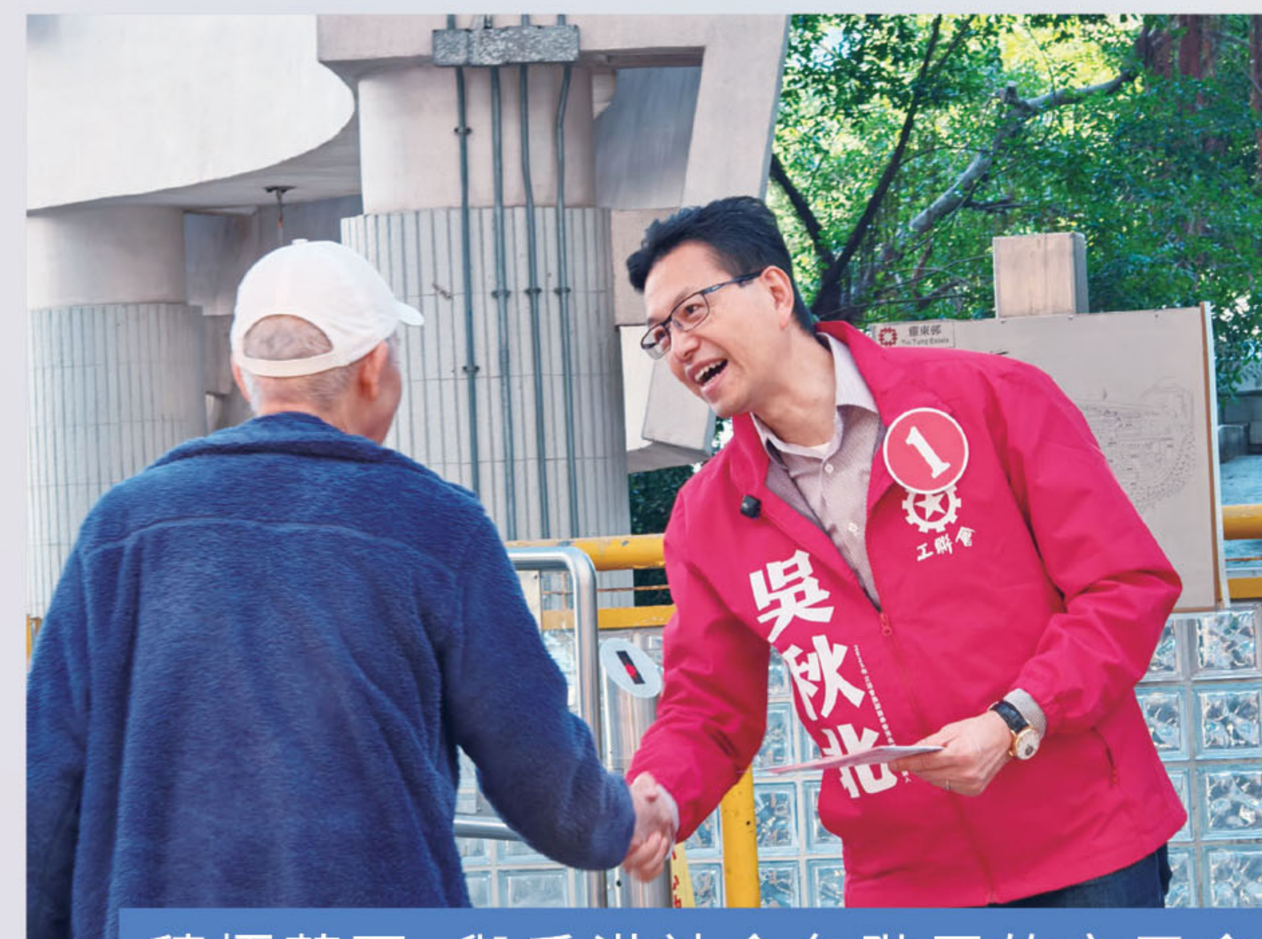
積極落區，與香港社會各階層的市民會面，聆聽民意，了解市民關心的議題。