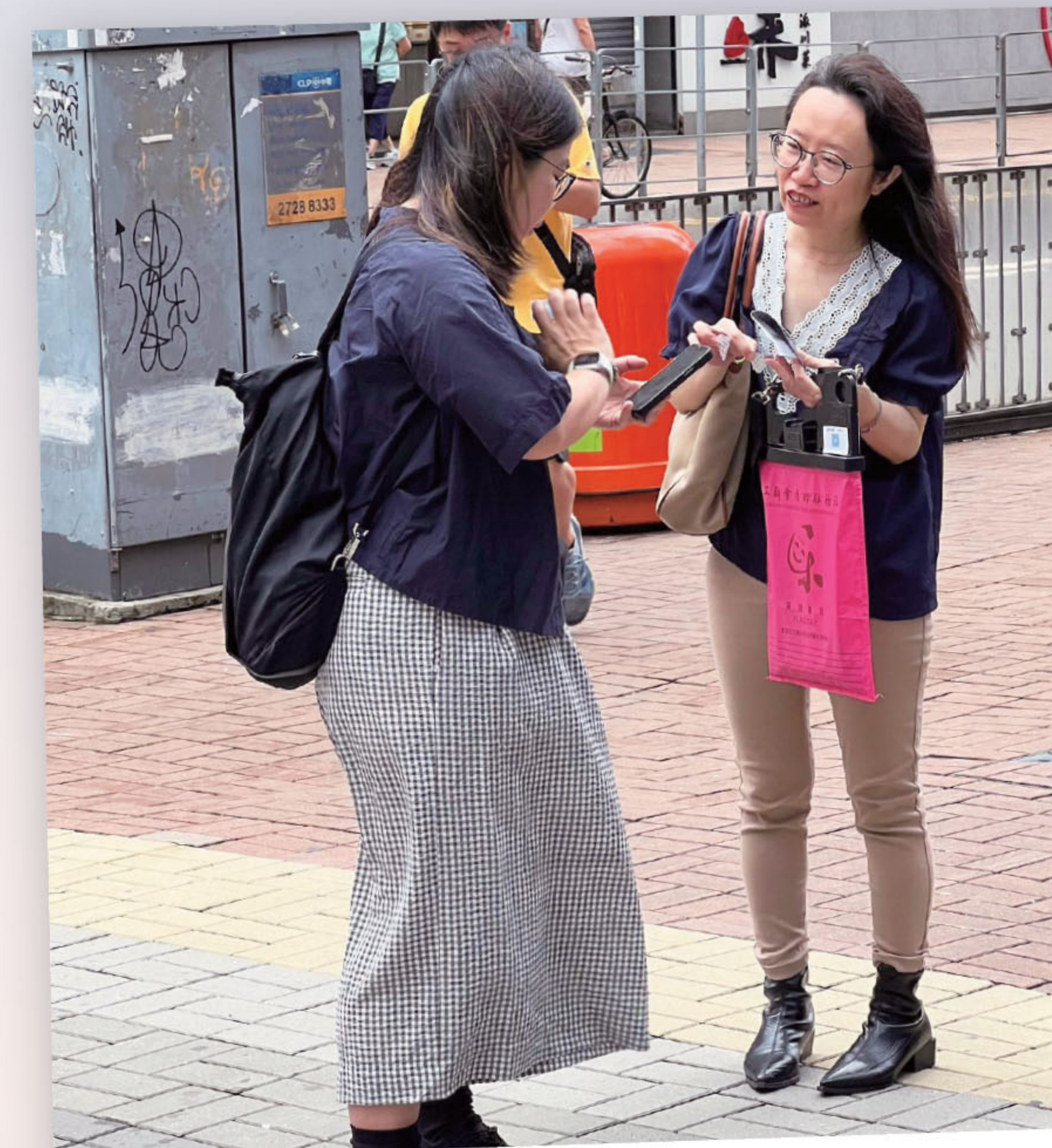
■ 踐行社區治理，關愛社群。

紐角色，帶動香港旅遊服務行業發展；跨境醫療服務進一步提升，香港特區醫療券進一步擴展至更多灣區城市及更多不同醫療服務項目使用，大大便捷了灣區內的醫療服務；在內地的港澳台居民律師代理民事案件範圍進一步擴大，香港專業人士在灣區的發展得到進一步提升，推動香港人才的「軟聯通」。多項便民利民政策的落實，使得灣區內人流、物流、資金流得到進一步活躍，灣區生活的幸福感得到提升。2026年是國家「十五五」規劃的開局之年，作為政協委員要發揮自身所長貢獻國家所需，積極建言獻策，使香港為國家「十五五」規劃過程之中發揮其獨特作用，實現互利共贏的未來，為實現中華民族偉大復興而努力奮鬥。