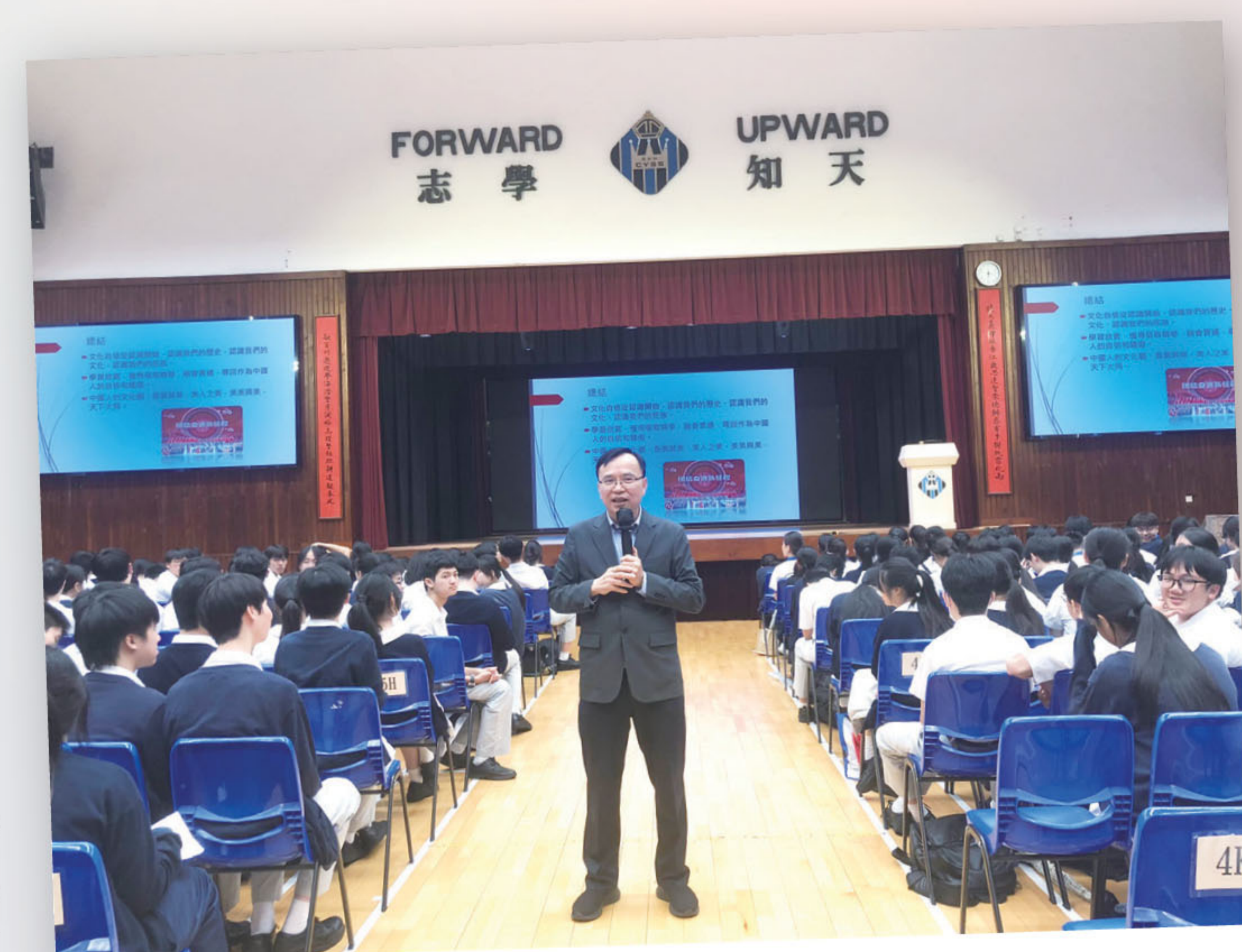
■ 入校舉辦愛國主義教育講座，向香港中小學生弘揚中國文化自信。