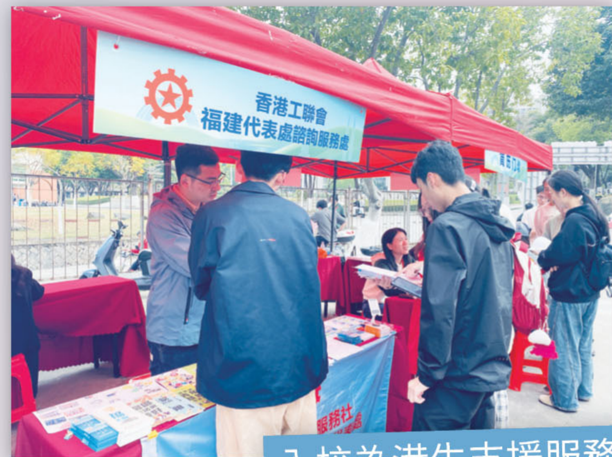
入校為港生支援服務