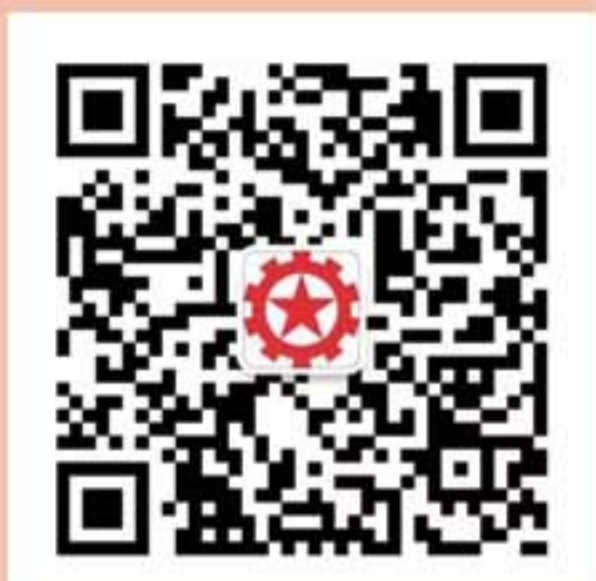
內地諮詢服務中心 微信公眾號