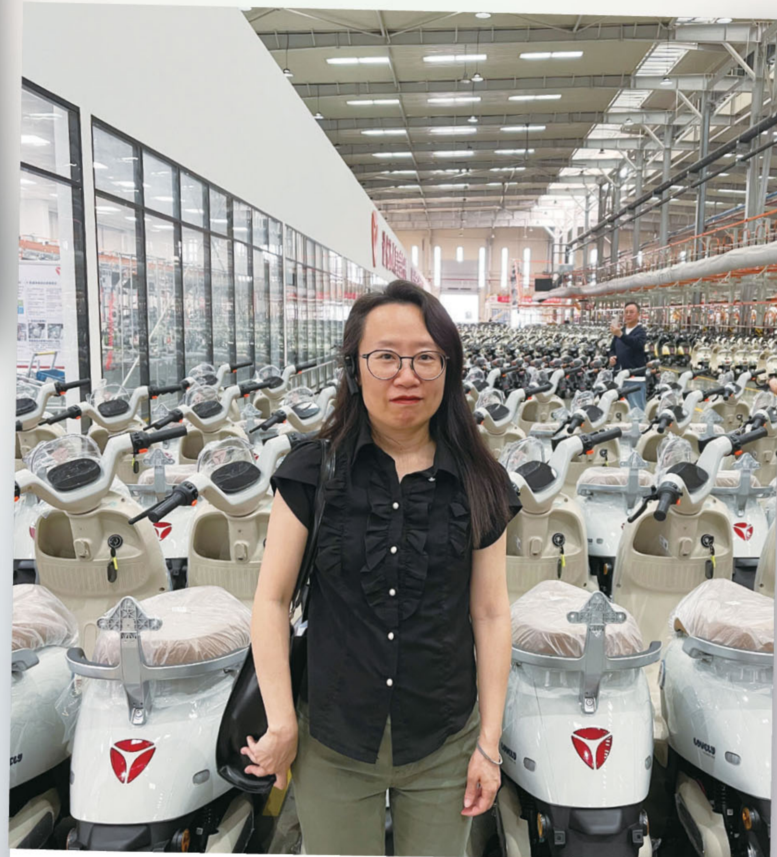
■ 考察電動電單車企業，助力新質生產力發展。

2025年也是「十四五」規劃的收官之年，作為全國政協委員，在多個領域建言獻策、參政議政，助力香港更好融入和服務國家發展大局。在粵港澳大灣區融合發展的議題上，欣喜樂見多項政策成功實施，其中包括「跨境支付通」實施，大大活躍了內地與香港之間的跨境金融流動以及民眾跨境匯款的便捷程度；開放更多內地城市赴港「自由行」以及恢復並擴展深圳居民「一簽多行」，提升香港「一程多站」國際旅遊城市樞