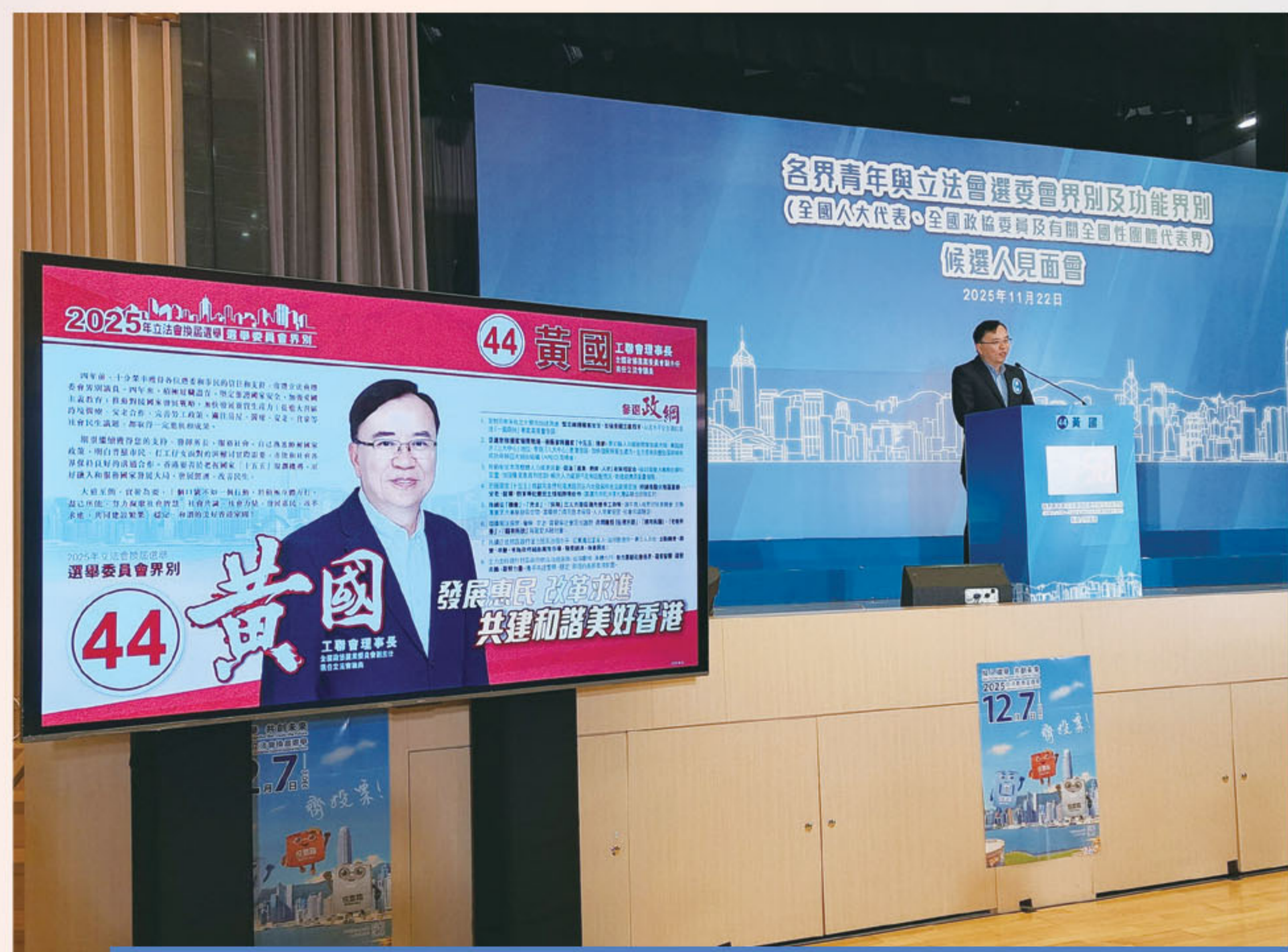
出席不同行業、團體舉辦的候選人見面會，宣講政綱倡議內容。

2025年，香港迎來第八屆立法會選舉，工聯會本次參選堅決貫徹「愛國者治港」原則，以實踐「共建共榮共享共贏」的新工運理念，為香港實現良政善治、長治久安貢獻自身力量。工聯會的港區全國人大代表、全國政協委員更是身體力行，投入選戰，攜手為香港的民主發展注入新動力，全力推動香港經濟繁榮穩定、共創更美好的香港。在肩負起維護國家安全、推動社會進步、保障勞工權益、改善市民生活等多個領域，發揮自身的使命擔當，為廣大香港市民服務。