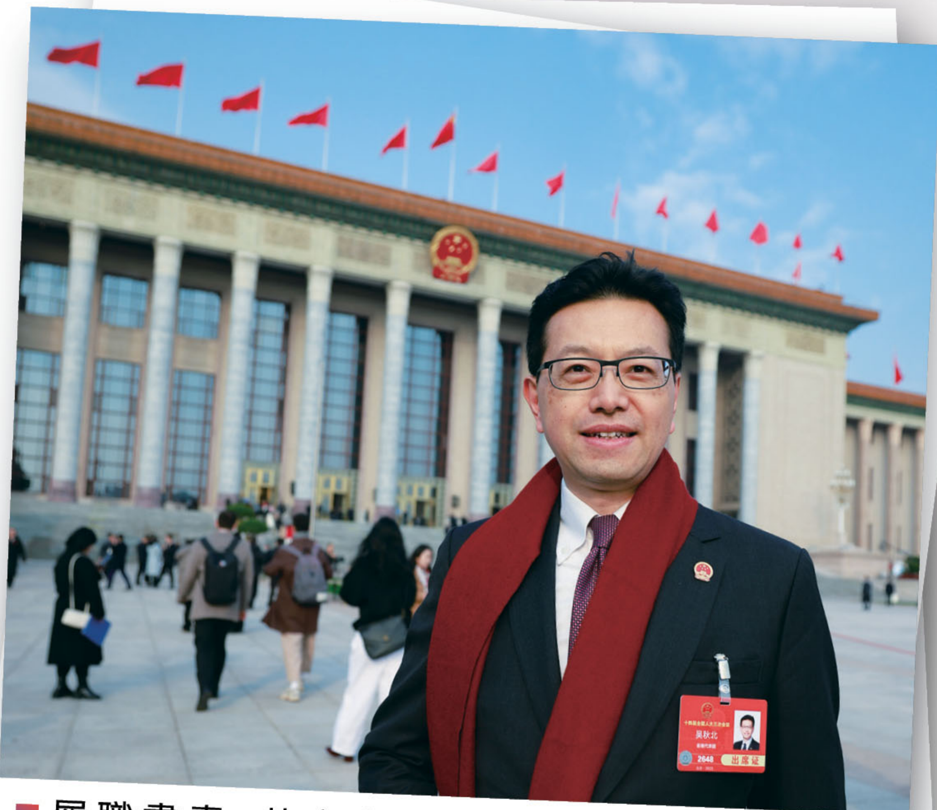
■ 履職盡責，赴京出席第十四屆全國人民代表大會第三次會議。

2025年，秋北謹記作為港區全國人大代表、香港團副召集人、工聯會會長的責任擔當，始終堅守「愛國愛港、為民發聲」初心，服務好代表團，緊扣國家規劃部署與香港融入國家發展大局核心任務，認真履行人大代表職責，積極建言獻策、聯繫民眾、推動落實，圓滿完成各項工作。