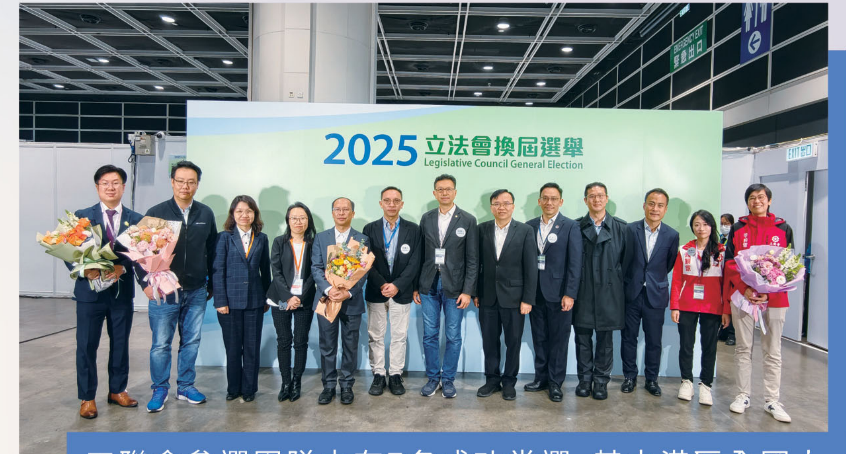
工聯會參選團隊中有7名成功當選，其中港區全國人大代表、工聯會會長吳秋北當選港島東地方選區立法會議員，全國政協委員、工聯會理事長黃國當選選舉委員會界別立法會議員。