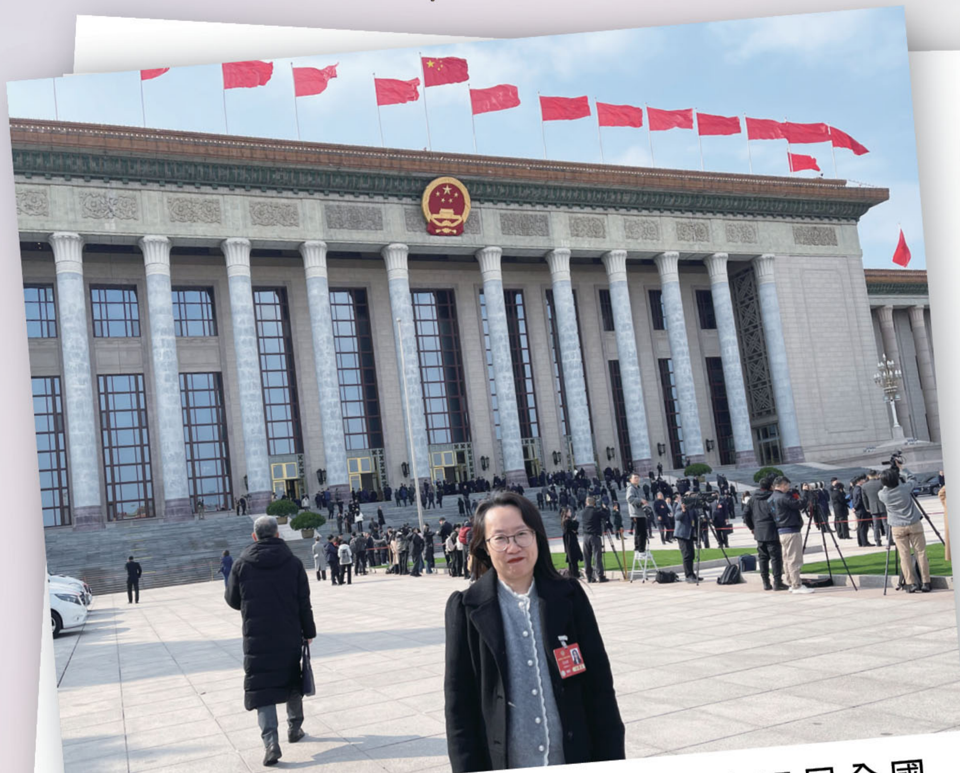
■ 出席中國人民政治協商會議第十四屆全國委員會第三次會議。

2025年是深刻且具時代意義的一年。過去一年，是東江水供港60周年，東江之水越山而來，在祖國的關愛下東深供水工程解決香港數以百萬人的用水難問題。過去一年，也是中國人民抗日戰爭暨世界反法西斯戰爭勝利80周年，在北京天安門觀看抗戰勝利80周年閱兵，14年浴血抗戰鑄造中華民族的自強與輝煌，見證中華民族由屈辱走向振興的偉大歷史轉折。過去一年，也是中華全國總工會成立100周年，這場波瀾壯闊的愛國工運歷程，也在香港掀起弘揚「劳模精神、勞動精神、工匠精神」的篇章。在2025年這意義重大的一年，個人致力發揮政協委員雙重積極作用，為全面推進中國式現代化強國建設及中華民族偉大復興作出應有貢獻。