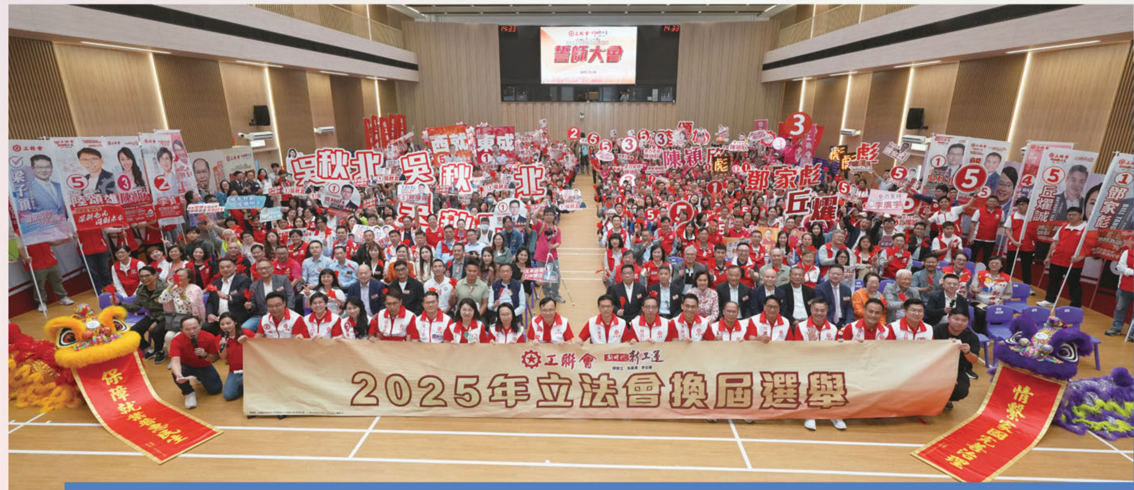
工聯會派出16人參選2025年立法會換屆選舉，圖為選舉誓師現場。

2025年，香港迎來第八屆立法會選舉，工聯會本次參選堅決貫徹「愛國者治港」原則，以實踐「共建共榮共享共贏」的新工運理念，為香港實現良政善治、長治久安貢獻自身力量。工聯會的港區全國人大代表、全國政協委員更是身體力行，投入選戰，攜手為香港的民主發展注入新動力，全力推動香港經濟繁榮穩定、共創更美好的香港。在肩負起維護國家安全、推動社會進步、保障勞工權益、改善市民生活等多個領域，發揮自身的使命擔當，為廣大香港市民服務。