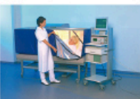
自然醫學 (圖為全身熱療)