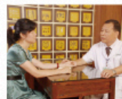
中醫 (圖為中醫辨證治療)