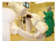
西醫 (圖為微創介入治療)