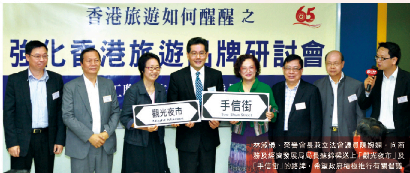
林淑儀、榮譽會長兼立法會議員陳婉嫻，向商務及經濟發展局局長蘇錦樑送上「觀光夜市」及「手信街」的路牌，希望政府積極推行有關倡議。

工聯會旅遊聯業委員會（委員會）於7月23日舉辦了一個名為「香港旅遊如何醒醒之強化香港旅遊品牌」研討會，吸引了政府、旅遊發展局、業界經營者和工會代表逾百人出席。業界促請政府打造「特色夜市」、「手信街」等新景點，令香港旅遊業持續發展，守護香港「旅遊之都」的美譽。