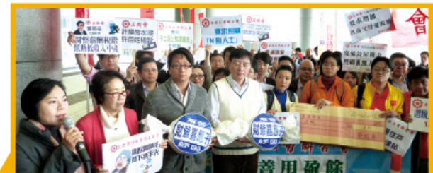
社委：要求財爺善用盈餘退稅紓困