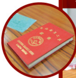
▲ 這是任勞的海員工會證書。