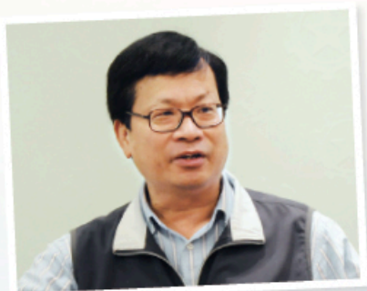
▲ 身兼全國人大代表的工聯會榮譽會長鄭耀棠強調，國民教育非意識形態問題，是國民身份認同根本問題。

鄭耀棠自 1988 年已成為全國人大，雖然這是全國的立法機關，但一直在港沒有明顯地位，回歸後情況稍為改善，不過港人對全國人大的角色功能仍模糊。