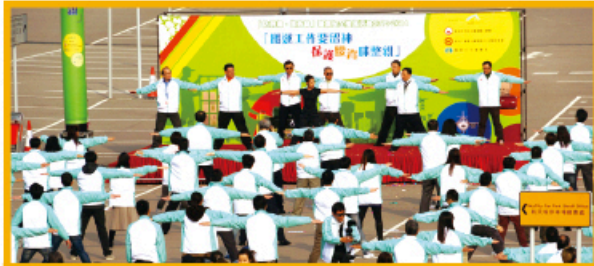
職安委：「防勞損 護筋骨」職業安全推廣