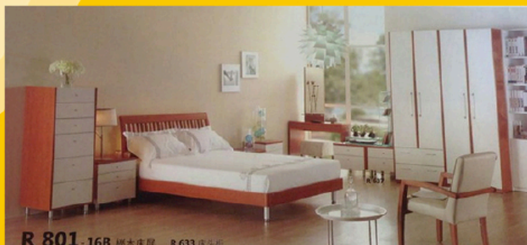
R 801-16B 柚木床房 R 633 床頭櫃