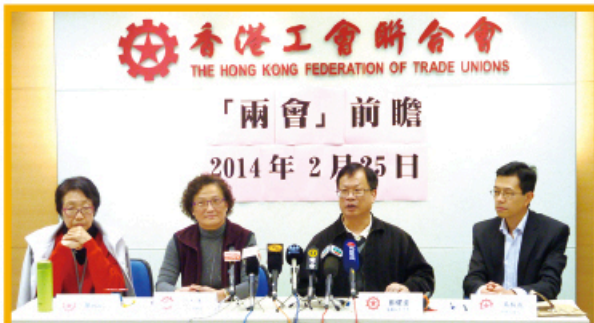
工聯「兩會」建言獻策