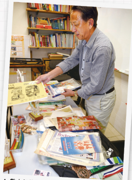
▲ 數十年的長跑戰利品，數量驚人。

事，因為有目標就有壓力，以往比賽沿途風景幾靚都睇唔到，現在舉辦賽事心態不同、是享受，也喜歡到內地跑，感受氣氛及旅行風景。」