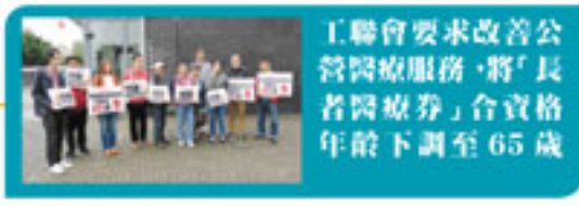
工聯會要求改善公 營醫療服務，將「長 者醫療券」合資格 年齡下調至 65 歲