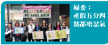
婦女： 產假五分四 點都唔忿氣