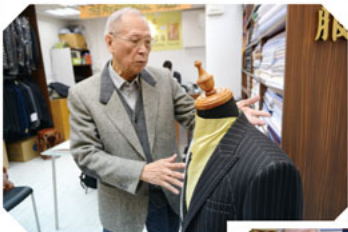
▲ 布料的好壞也決定一件西裝是否稱身合適。