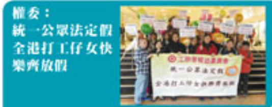
權委： 統一公眾法定假 全港打工仔女 快樂齊放假