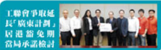
工聯會爭取延 長「廣東計劃」 回港豁免期 當局承諾檢討