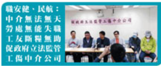
職安健、民航： 中介無法無天 勞處無能失職 工友斷糧無助 促政府立法監管 工傷中介公司