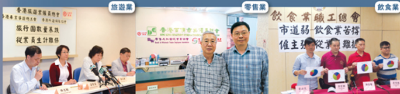
▲ 多個工會講述業界情況