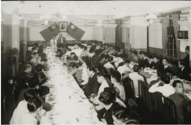
香港工會聯合會第一屆會員代表大會全體代表來賓留影

◀ 1948 年 4 月 17 日於灣仔六國飯店舉行第 1 屆會員代表大會，當時由 22 間工會組成