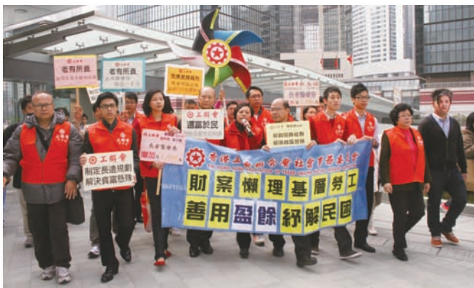
社委代表帶同貼有訴求的五色巨型風車和橫額標語到場請願

業交通津貼計劃」申請資格、加強長者福利可攜性、擴大各類乘車優惠等等，社委對此表示不滿，促請政府正視訴求。