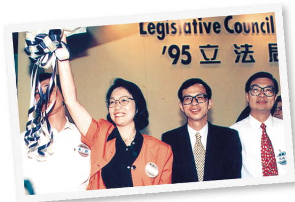
▲ 嫻姐在 1995 年立法局選舉中當選為立法局議員。