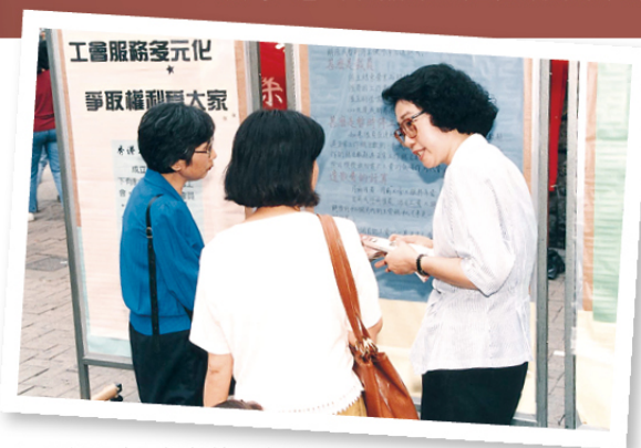
▲ 嫻姐向市民解釋勞工法例