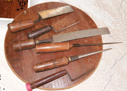
▲ 製作紅木家具需要上百件工具

這不是普通木製家具能相比的；另一價值是師傅的手工藝，入榫等製作方式都是中國傳統獨有的，堅固耐用而且古典清雅。這些都是無法被取代的。