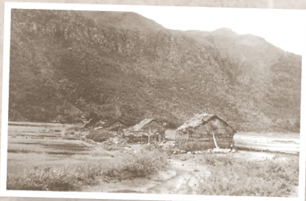
▲ 1950年代的鹽工住宿地方。（《大嶼山》）

這位令人敬重「鹹蛋先生」在今年六月走完傳奇一生，其所付出的貢獻及無私精神令人懷念！