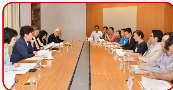
▲ 工聯會負責人及立法會議員與行政長官林鄭月娥會面，就《施政報告》提出建議。

工聯會的研究發現，自 2004 年至 2015 年的 11 年間，本地生產總值的累計升幅達 82%，但僱員名義工資指數升幅只有 45.7%，扣除通脹後的實質工資更只有 0.5% 增長，薪金增長停滯不前。