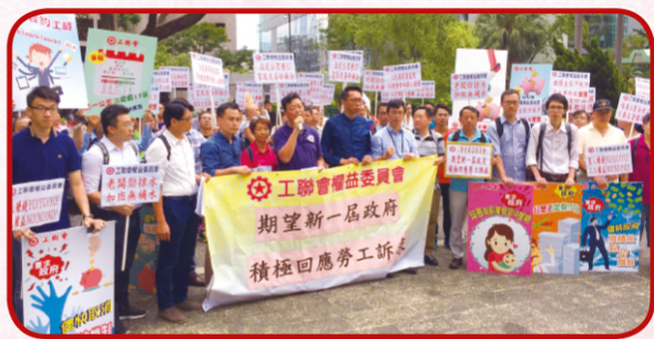
▲ 權委聯同各工會代表合共約100人向新一屆政府表達訴求。

不少打工仔皆面對低工資、長工時問題，加上新的就業模式出現，例如職位零散化或彈性工作等，僱員更難得到