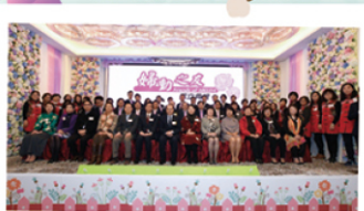
婦動之友成立典禮