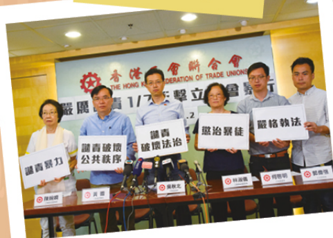
工聯會召開記者會，對7月1日傍晚有人以極端暴力衝擊立法會、肆意破壞的暴徒行為予以最嚴厲譴責！