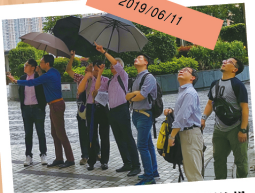
工聯職安健協會外牆工作安全關注組、立法會議員陸頌雄、勞工處剛成立的「外牆工作安全專責小組」，考察將軍澳一帶近年新落成樓宇的設計問題。