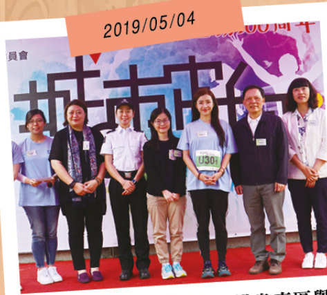
工聯會青年事務委員會在港島東區舉辦「城市定向」賽事，今年報名隊伍達133隊，人數超過300人。