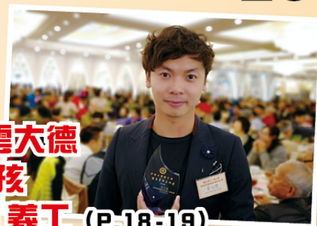
坦白說：雲大德 陽光大男孩 工聯「老」義工 (P.18-19)