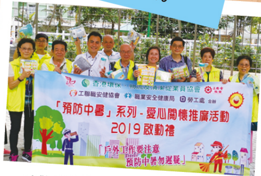
工聯職安健協會與不同相關工會、職業安全健康局、和勞工處合辦「預防中暑」愛心關懷推廣活動2019，在不同工作地點舉行啟動禮，讓從事戶外工作的工友認識預防中暑的資訊。