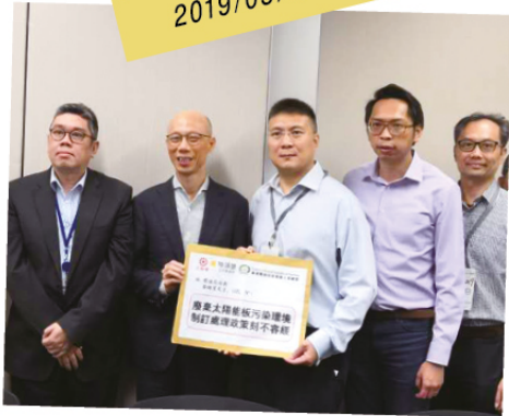
香港環保科技專業人員總會和陸頌雄約見環境局局長黃錦星，就有關廢棄太陽能板處理政策事宜提出建議。