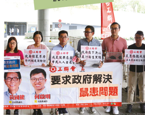
工聯會社會事務委員會到立法會外請願，並向工聯會立法會議員遞交請願信，要求政府解決鼠患問題。