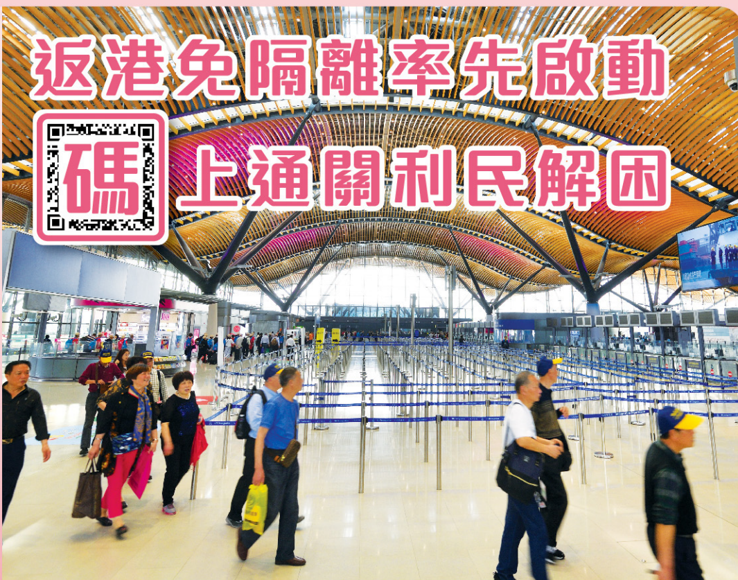
香港儘快推出「健康碼」，有序恢復通關，對重啟經濟非常重要。

疫情反覆，過關檢疫安排持續，基於香港疫情未受控，無法推出「健康碼」便利通關，很多內地港人只能忍著不回港。工聯會接獲不少內地港人求助，他們因未能回港覆診，面臨斷藥甚至病情惡化，部分人要由救護車緊急從內地送回港就醫。工聯會一直爭取疫情受控後儘快推出「健康碼」，恢復經濟活動，解決市民的跨境需要，並先免卻內地回港市民14天檢疫。特區政府積極回應工聯會訴求，宣布11月起內地港人返港可豁免檢疫14天，開始時會有配額，方便兩地人員往返。