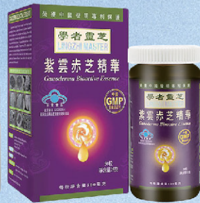
學者靈芝紫雲赤芝精華