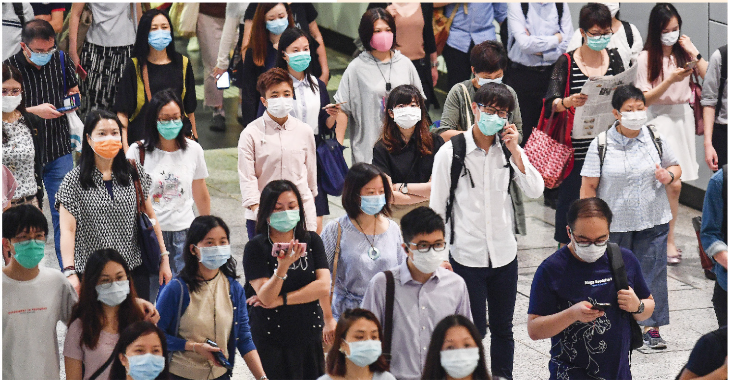
年關在即，裁員潮恐爆發，打工仔女隨時飯碗不保。

大裁員殺到，加上新型勞工問題湧現，特區政府必須變招救失業、創就業！各行各業去年中開始已受「黑暴」重擊，加上疫情持續，國泰航空啟動香港史上最大規模裁員，裁減約5,300名駐港員工。一間企業，一聲重組，半萬打工仔女即時打爛飯碗，政府救失業卻仍失焦離地，例如以失業綜援來搪塞設立失業／停工現金津貼的訴求，但綜援申請人卻被要求「Cut保單」，先花光現金價值。學者和工聯會均指出，企業年關難過，失業率短期內恐破7%，政府須立刻變招，儘快推出現金津貼，並繼續優化再培訓課程，達到「與疫症並行」，從而推動就業和轉業。