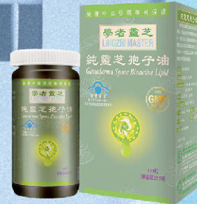
學者靈芝靈芝孢子油