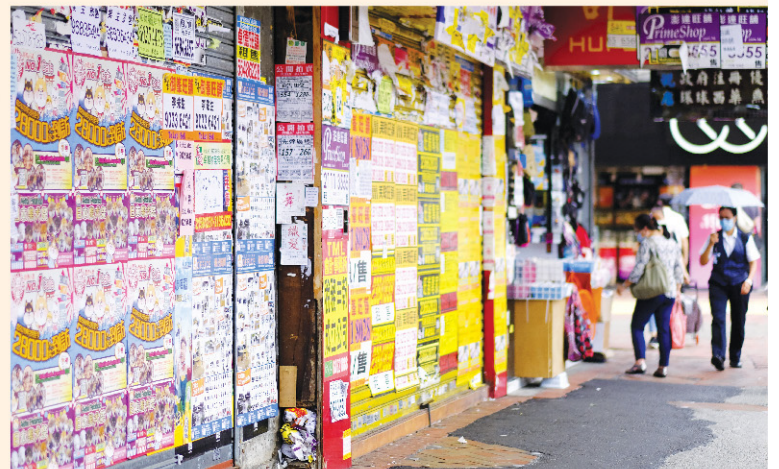
重災行業包括零售仍然慘淡，滿街可見吉舖。

唐廣堯促請社署調整失業綜援的申領條件，包括容許以「個人」名義申請，並豁免審批保險的現金價值一段時間，讓失業者順利領取失業綜援。事實上，若政府設立失業／停工現金津貼，便可更直接「救命」，毋須再費周章。