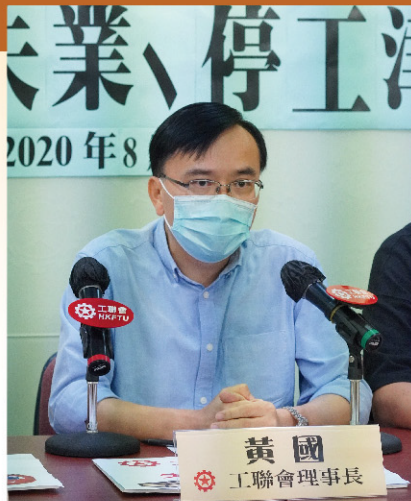
黃國指出，疫情之下不少打工仔女正身處「懸崖邊緣」。

疫情引發的停工、裁員潮撲向各行各業，不少打工仔女接連受「黑暴」和疫情衝擊，已失業超過一年，近月更感搵工愈來愈難，哀嘆不知何時才能重投職場，擺脫失業困境。