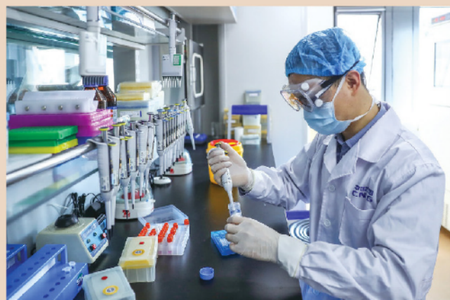
國家全力支援香港疫苗接種，特區政府能把握機會，將抗疫工作做好。

要達到「群體免疫」佳效，接種疫苗人數應達整體7成以上，黃國提醒說：「如果打疫苗似普及社區檢測搞到『半桶水』，疫情一樣難以清零。我們都知道疫苗不是100%有效、100%沒有副作用，但卻是代價最小、最有效和最可行的方案。政府不能瞻前顧後，推動打疫苗的決心一定要堅定，而且要爭取在兩、三個月完成。若疫苗接種還要耗上半年時間，香港實在很難捱下去。」