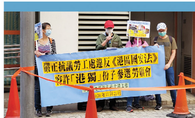
市民抗議勞工處放任「攪炒」、「港獨」分子入關。

鄧家彪強調，爭取勞工權益必須有理有節，而非你死我活，製造撕裂、深化矛盾只會雙輸，理性協商才能為打工仔女爭取更多合理權益。他相信，當選的僱員代表將繼續團結勞工界，捍衛打工仔女權益，與市民齊心跨過困境。⚙️