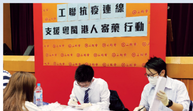
工聯會去年承辦「寄藥行動」，需求殷切，揭示兩地醫療須加速融合。

以上兩例，凸顯了內地港人的龐大醫療需要，他們擔心的不止是在內地求診的開支問題，還有對轉用內地藥物的憂慮。容許大灣區內地城市的指定港資醫療機構可使用香港註冊藥物和常用的醫療儀器，賦予港人在大灣區安居、養老更大的便利和信心，是施政報告貼地、務實的重要舉措之一。