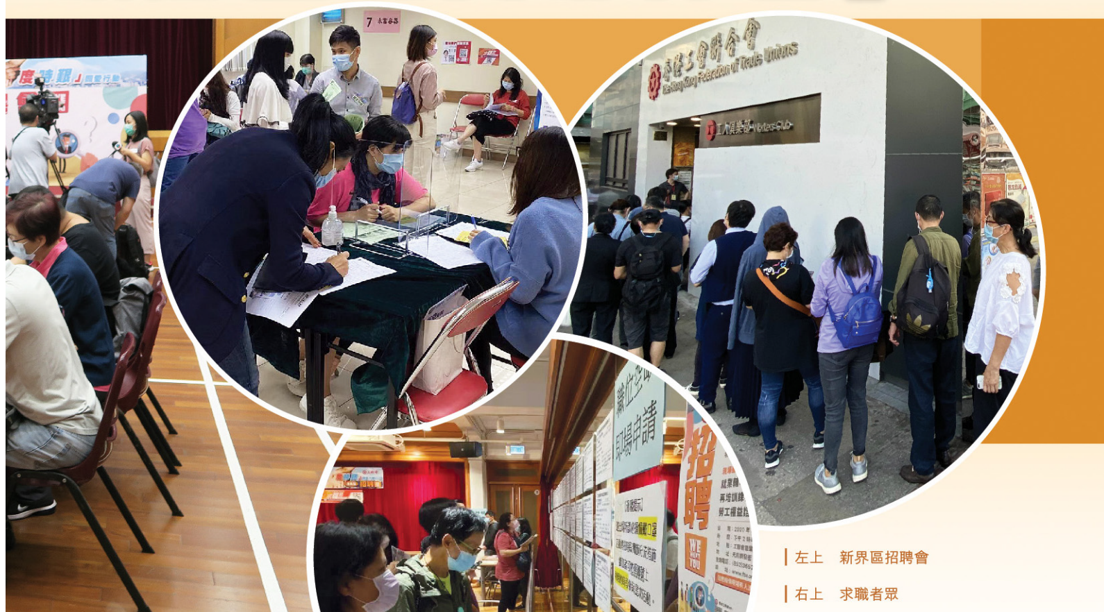
左上 新界區招聘會