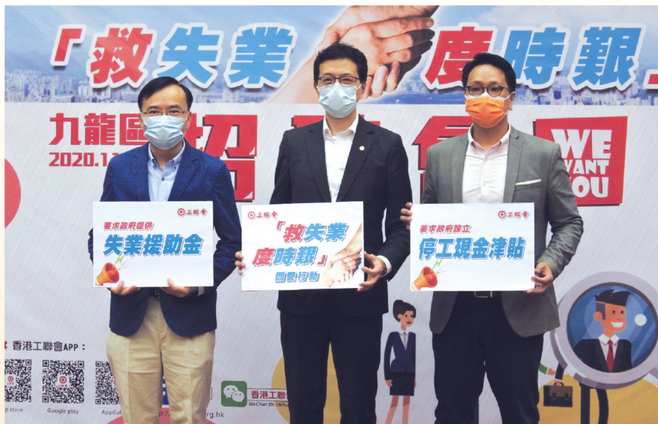
工聯會「救失業 度時艱」關愛行動全力支援疫下打工仔女。

工聯會早前多次向政府反映，失業人士受種種舊有條例約束，未能成功申領失業綜援，包括保單持有人要先「cut單」花光現金價值，以及失業綜援不接受個人申請。雖然《施政報告》回應了工聯會訴求，豁免計算保單現金價值，但以個人名義申領失業綜援