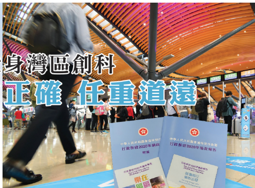
施政報告提出多項新措施鼓勵香港年輕人融入大灣區發展。

另外，特區政府會在疫情過後推行「青年創業計劃」，為近200家青年初創企業提供資助，大灣區內地城市已同意支持計劃，讓香港青年享有與內地青年相同待遇和支援。事實上，深圳、廣州等大灣區內地城市一直為北上創業者提供援助，例如稅務優惠、低廉租金和財務支援等，共享工作基地亦有助孵化產