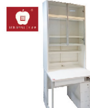
31.5" 書櫃連書架 33-0813-00-5088+5090 TR730S $3560 會員特價 $3026

圖片只供參考，優惠貨品有限，售完即止。價格如有更改，以店內價格為準，恕不另行通告。本公司保留是次推廣活動之一切決定權。