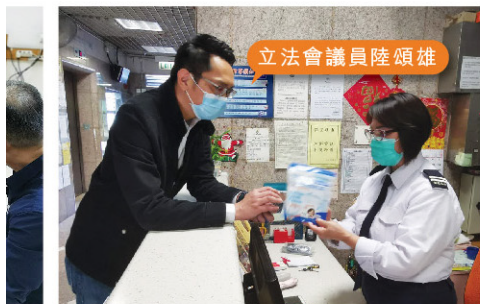
立法會議員陸頌雄