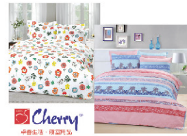
Cherry 新花蜜桃絨冷氣被 單人至加大 20-2370-00-1111-1113