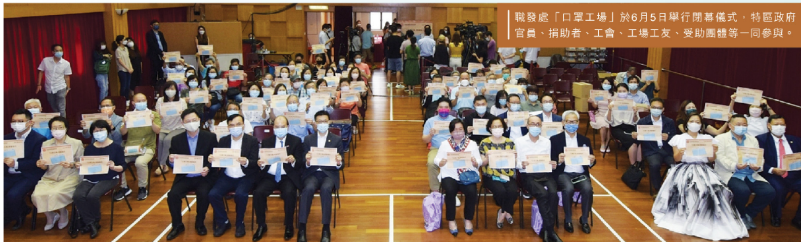
職發處「口罩工場」於6月5日舉行閉幕儀式，特區政府官員、捐助者、工會、工場工友、受助團體等一同參與。

在2020年2月疫情迅猛襲港之初，工聯會職業發展服務處（下稱「職發處」）憑著「自己口罩自己做」和急市民所急的理念，開設「口罩工場」，用了十七個月的時間，達到了生產1000萬個口罩的目標，送贈予長者、基層等弱勢社群及前線工友，發揮了社區互助、同心抗疫的精神。隨著防疫物資供應已達穩定，「口罩工場」完成歷史使命，此慈善項目圓滿結束。「口罩工場」6月5日於工人俱樂部舉行閉幕儀式，邀請到時任政務司司長張建宗、創新及科技局局長薛永恒、創新及科技局常任秘書長蔡淑嫻和勞工及福利局副局長何啟明擔任主禮嘉賓。