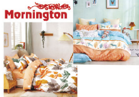
Mornington 全棉床上用品套裝 床笠+被袋+枕袋(單人-加大) 21-2933-00-1095-1097 $359-459