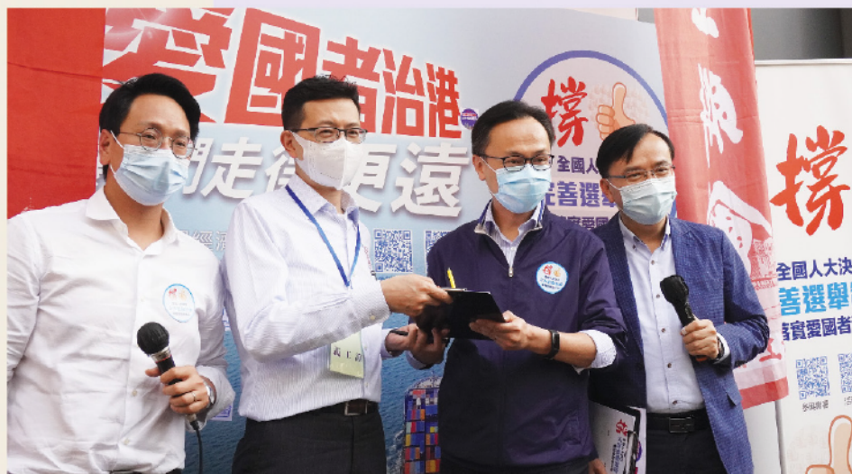
全國人大完善選舉制度的決定出台後短短10天，238萬香港市民簽名表示支持。 圖為公務員事務局局長聶德權當時到工聯會街站簽名。

中國有一句俗語，叫「懷菩薩心腸，行霹靂手段」。我認為，以此來形容制定實施香港國安法和修訂完善香港選舉制度這兩大舉措是十分貼切的。中央所做的一切都是為了讓「一國兩制」實踐沿著正確方向行得更穩、走得更遠，都是為了確保香港繁榮穩定、長治久安，都是為了維護香港居民的安居樂業、增進香港居民的利益福祉。我也高興地看到，香港國安法頒佈實施後，街頭「黑暴」偃旗息鼓，