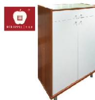
雙門雙桶鞋櫃 33-0813-00-5011 TR5312 $1780 會員特價 $1513