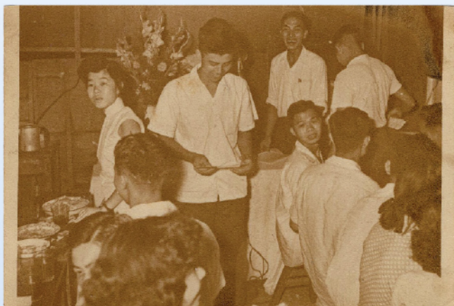
1956年，工會會員及家屬參與聯歡茶會。