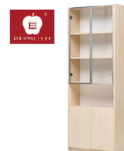
雙玻璃門書櫃 33-0813-00-5022 TR7332-0.8 $2580 會員特價 $2193