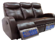
三座位真皮面雙電鉸梳化 39-0380-1032-13 $9580 會員特價 $5999