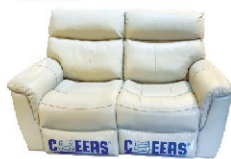
雙座位電鉸梳化 39-0380-1030-12 $9080 會員7折 $6356