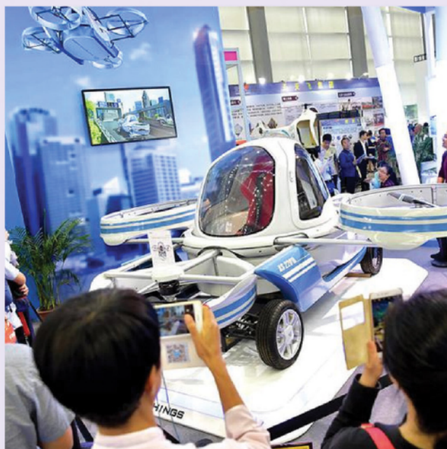
大灣區擁有人工智慧、5G、數字互聯網等新興產業的良好基礎，蘊藏無限發展機遇。

其次，我希望香港的年輕人發揚獅子山精神，不觀望、不猶豫，更加積極進取地行動起來。香港自開埠以來，從小漁村演變成國際大都市，離不開拼搏、創新、自強、樂觀的獅子山精神。老一代的香港人當年白手起家，發揮聰明才智，歷盡千辛萬苦，創造了亞洲四小龍的奇迹；香港年輕人的父輩們，同舟共濟，挺過了亞洲金融危機、非典、全球金融危機，使香港國際金融、貿易、航運中心的地位更加鞏固。如今，香港年輕人精通「兩文三語」，