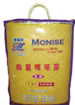
夢麗詩頂級嗎呢蓆 3呎-5呎 $2350-3880