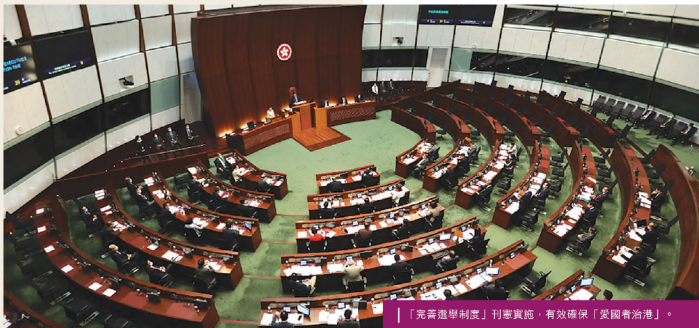
「完善選舉制度」刊憲實施，有效確保「愛國者治港」。