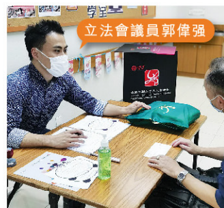
立法會議員郭偉強