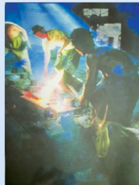
上世紀70年代，沙模工友正在澆注鐵水。