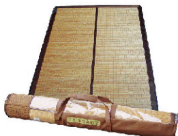
夏日清涼竹蓆 3呎-4呎 21-2933-000635-0536 $229-269