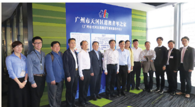
工聯會負責人到訪「廣州市天河區港澳青年之家」了解協助港澳青年創業的工作。

答：首先，我希望香港的年輕人把大灣區看作為成就夢想的大舞台。IMF（國際貨幣基金組織）預測，中國將貢獻未來五年世界經濟增長的三成以上，成為引領世界經濟增長的重要引擎。粵港澳大灣區則是我國開放程度最高、經濟活力最強的區域之一，在全球企業500強、QS世界大學排名、全球金融中心指數、全球創新指數、全球最佳機場等各種國際排名中表現優異。大灣區擁有人工智慧、5G、數字互聯網等新興產業的良好基礎，蘊藏無限發展機遇。近年來，為了吸引港澳青年來粵發展，廣東省聯合香港特區政府共同建設了「1+12+N」青年雙創基地，提供堅強有力的政策支撐。可以說，大灣區已經成為港澳青年創新創業的最佳舞台。