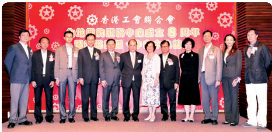
勞工及福利局局長張建宗，社會福利署署長聶德權，入境事務處副處長鍾林慧，中聯辦社工部副部長李運福出席酒會

為更好服務內地港人需要，工聯會進一步擴展內地中心，分別於7月23日及27日正式為惠州工聯諮詢服務中心（惠州中心）和中山工聯諮詢服務中心（中山中心）揭幕，以及於8月22日在香港舉行慶祝內地中心成立八周年暨新增惠州、中山中心誌慶酒會，以慶祝內地服務揭開新的一頁。