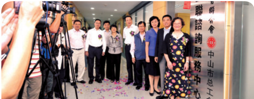
出席中山中心剪綵儀式的嘉賓有：中山市委常委兼統戰部部長梁麗嫻，中山市人大副主任兼市總工會主席區碧群，省港澳辦副主任盧興洲，省總工會巡視員孔祥鴻，中聯辦社工部部長張鐵夫，駐粵辦主任朱經文

應邀出席的勞工及福利局局長張建宗於會上亦感謝工聯會長久以來服務內地港人的熱誠和努力，他表示內地中心新增服務點乃