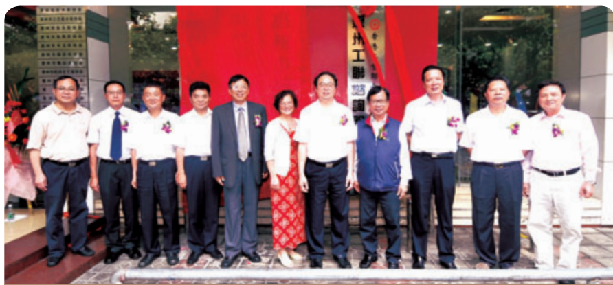
應邀出席惠州中心開幕儀式的嘉賓有：惠州市委副書記陳訓廷，惠州市人大副主任、市總工會主席朱挺青，惠州市政協副主席吳選釗，中聯辦社工部副部長鍾榮熾，省總工會巡視員孔祥鴻，省港澳辦副主任盧與洲，駐粵辦主任朱經文