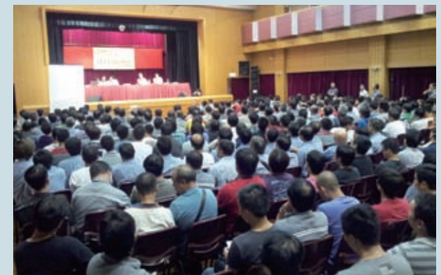
工會與員工召開大會，了解他們加薪意向

葉偉明表示，目前電梯維修技工時薪偏低，要求資方調薪是維護員工的合理權益，而合理加薪能提升工人的專業地位，並吸引更多年青人投身行業。