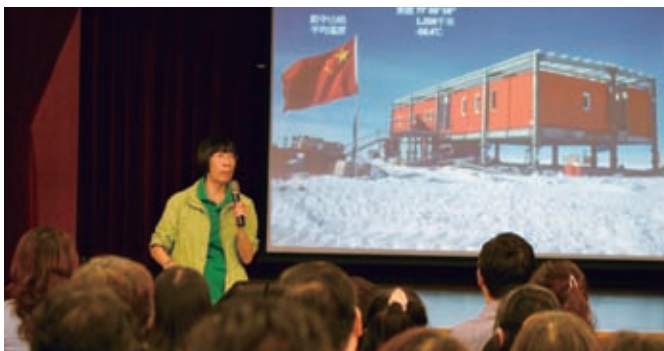
李樂詩與大家分享在南北兩極及珠峰的體驗，和對人生及大自然的反思