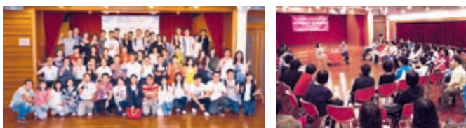
時任行會召集人梁振英與青年就「現今香港青年還有機會向上流動嗎？」交流 上屆行會成員、溢達集團主席楊敏德，和與會者探討「如何突破自己、建立創新思維」